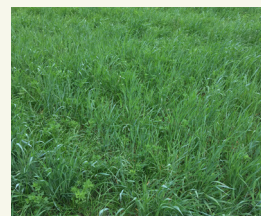
Fig. 1: La miscela graminacee e leguminose, può essere utilizzato anche per il pascolo

Un gruppo ben studiato di miscugli di specie sono le miscele graminacee e leguminose (fig. 1). Il risultato di tali miscele è una eccellente distribuzione di radici nel suolo (fig. 2). Inoltre miscele con una percentuale di 40-60% di leguminose possono aumentare la fissazione dell'azoto da parte di queste rispetto a quanto accade con le sole leguminose (Nyfeler et al. 2011). Un altro vantaggio di miscele graminacee e leguminose è che possono essere utilizzati anche per il pascolo, il che li rende interessanti per le regioni con sistemi agricoli misti, basati su colture erbacee e produzione casearia. Soprattutto durante gli anni caratterizzati da condizioni climatiche estreme questi prati "riserva" hanno un alto valore.