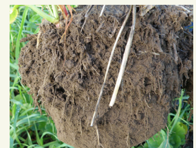
Fig. 2: Colonizzazione del suolo da parte delle radici di una miscela foraggere-leguminose