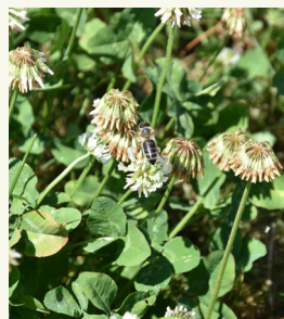
Fig. 3: Trifoglio bianco è una pianta da foraggio eccellente per le api.

Come accennato in precedenza, alcune colture di copertura possono essere utilizzati per l'alimentazione del bestiame. Un altro importante gruppo di animali che possono essere alimentati con colture di copertura sono le api e impollinatori in generale (fig. 3). La maggior parte delle colture agricole sono in fiore in primavera - inizio estate. Le colture di copertura sono un ottimo modo per fornire api con polline e nettare alle api durante l'estate e la stagione autunnale. Leguminose, specie crucifere, grano saraceno e phacelia sono piante eccellenti per alimentare le api, In particolare la facelia (fig. 4) è spesso è coltivata con l'obiettivo particolare di nutrire le api.