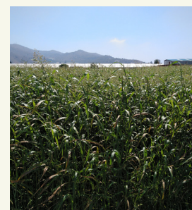
Fig. 6: Sudangrass in estate (> 35 ° C), nel sud della Spagna

Ulteriori informazioni su biofumigazione sono pubblicate come note in EIP-AGRI: