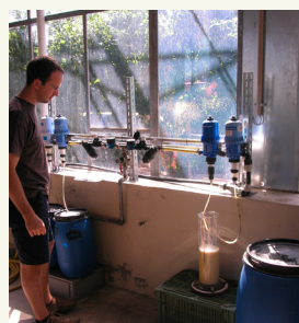
Fig. 4: La farina sgrassata di senape può essere applicata al terreno in forma liquida, anche dopo aver seminato le colture.