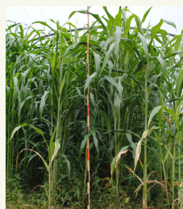
Fig. 5: Sorghum-sudangrass 8 settimane dopo la semina sotto tunnel.

Il termine 'biofumigazione' è stato originariamente definito come il processo di crescita, macerazione / incorporazione delle Brassiche o specie affini nel terreno, che porta al rilascio di isotiocianati attraverso l'idrolisi dei glucosinolati contenuti nei tessuti vegetali (Kirkegaard et al., 1993). Ma le cultivar di sorgo ( Sorghum bicolor ) e il sorgo-sudangrass ( S. bicolor x S. sudanense ) con alto contenuto di dhurrin, una sostanza che è trasformata in acido cianidrico tossico (chiamato anche acido prussico) sono anch'esse piante che possono essere utilizzate per biofumigazione (de Nicola et al., 2011). Entrambe le specie sono ben adattate per la crescita in condizioni di temperatura elevata, come si verifica sotto serra in estate (fig. 5). Pertanto queste sono adatte alle regioni dell'Europa meridionale (fig. 6). Un altro vantaggio è che sono colture erbacee particolarmente adatte per la rotazione nei sistemi produttivi orticoli.