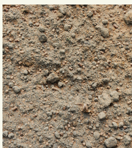
Fig. 3: Pellet di farina di senape sgrassata prima dell'incorporazione nel terreno.

Un altro modo per applicare isotiocianati al terreno è di utilizzare dei prodotti liquidi a base di farine di Brassica (fig. 4). In questo caso, la farina viene manipolata prima dell'applicazione. Attraverso questa manipolazione, i glucosinolati sono trasformati in isotiocianati e poi disciolti in un liquido che viene applicato al terreno mediante una irrigazione a goccia.