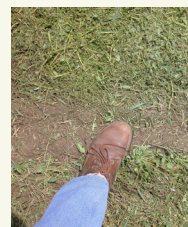
Fig. 1: Quanto più finemente le piante, saranno sminuzzate, tanto più rapidamente si produrranno abbondanti isotiocianati.

Un'alternativa per aumentare la quantità di isotiocianati nel suolo è l'uso di farine di Brassica con alto contenuto di glucosinolati (PATALANO, 2004). Tali prodotti sono commercialmente disponibili e in molti casi venduti come fertilizzanti organici (fig. 2). Pertanto, la loro efficacia non è conosciuta in quanto tali prodotti non subiscono una valutazione di efficacia, come nel caso dei prodotti registrati come pesticidi. Tuttavia, la quantità di farine da aggiungere al terreno è limitato dal suo contenuto di nutrienti, generalmente azoto in prima istanza.