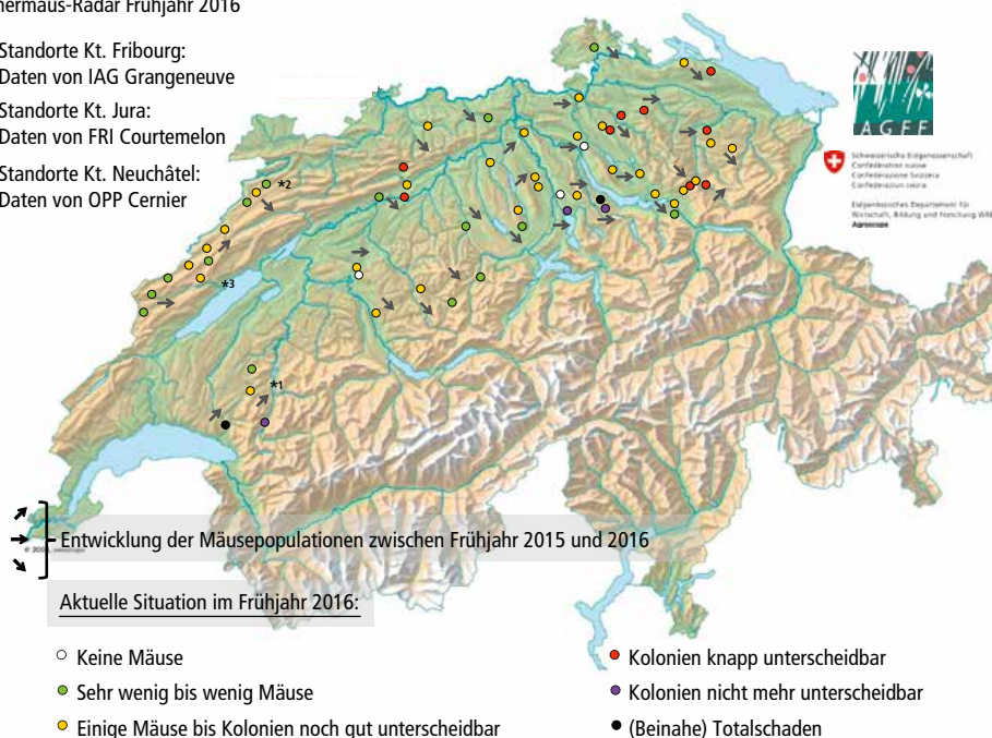
Abb. 2 | Übersichtskarte mit Standorten des Schermäus-Radars im Frühjahr 2016.