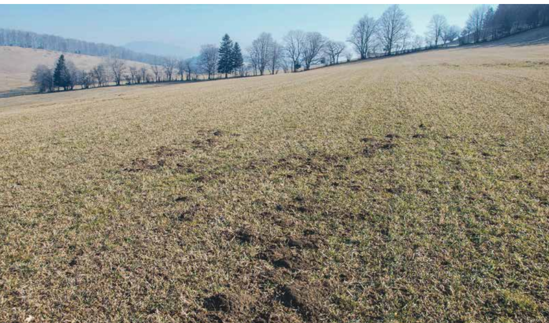
Abb. 1 | Typisches Beispiel eines Schermausbaus bei geringer Mäusedichte. Ein Bau besteht aus einem stark verzweigten Gangsystem, das eine Ausdehnung von bis zu 10 × 10 m erreichen kann. Auf der Oberfläche erkennt man einen Bau anhand der mehr oder weniger deutlich zusammenhängenden Ansammlungen von Mäusehaufen.

Auskünfte: Cornel J. Stutz, E-Mail: cornel.stutz@agroscope.admin.ch