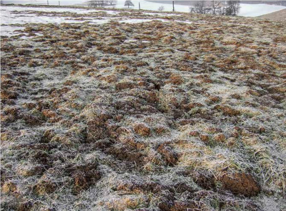
Abb. 4 | Ein sehr hoher Mäusebefall führt zu grossen Schäden in einer Wiese. Das Bild zeigt eine Dichte der Kategorie «Totalschaden».

den Plans eingezeichnet und gezählt, solange sie bei geringer Dichte noch unterscheidbar sind (Abb. 3). Die Auszählbreite sollte pro Person 10m nicht überschreiten. Sind die zu erhebenden Streifen breiter, braucht es entsprechend weitere parallele Durchgänge. Es wird eine Fläche von mindestens 30 Aren empfohlen. Die Aufnahme muss bei kurzer Vegetation – zum Beispiel zu Vegetationsbeginn – erfolgen, damit keine Mäusespuren übersehen werden.