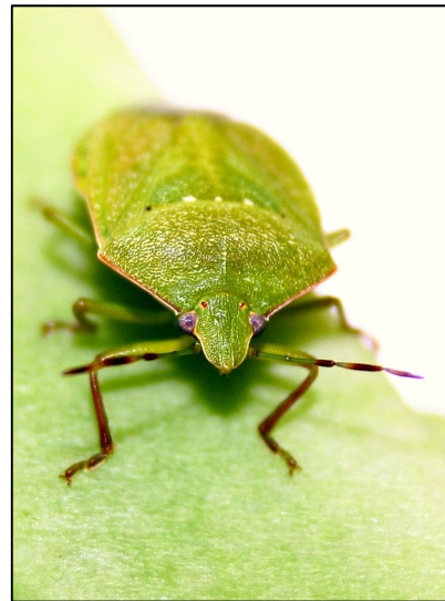
Adulte / Imago

Die grüne Reiswanze, ein neuer Schädling aus der Mittelmeerregion, befällt zahlreiche Gemüsekulturen im Gewächshaus