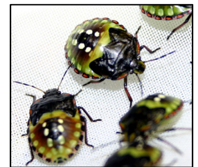
Larves / Larven

Trissolcus femelle introduisant ses œufs dans ceux de la punaise