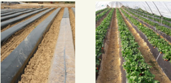
Fig. 1: Essai au champ avec des fraisières pendant la biosolarisation (à gauche) et culture (saine) consécutive (à droite).

Pour les cultures de fraises , plusieurs matériaux ont été testés dans différents pays, montrant des résultats prometteurs grâce à la biosolarisation avec du fumier de volaille frais pour lutter contre les champignons et les nématodes (López-Aranda et al., 2012; Zavata et al., 2014) (fig. 1).