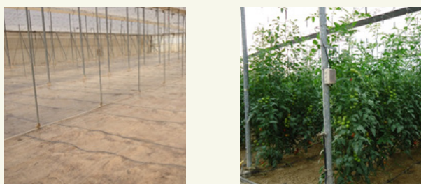
Fig. 3: Essai au champ avec des tomates pendant la biosolarisation (à gauche) et culture (saine) consécutive (à droite). Auteur: J. I. Marín.

organique fraîche (principalement un mélange de résidus végétaux et de fumier frais) suivie par une irrigation profonde et l'installation d'une bâche en polyéthylène transparent ou d'un film pratiquement étanche (VIF, virtually impermeable film). Certains producteurs sèment de la moutarde et d'autres brassicacées dans leurs exploitations pour les mélanger avec du fumier frais et/ou des résidus de culture. Dans de nombreux cas la biosolarisation est effectuée uniquement sur les lignes de culture (zones de culture), ce qui réduit la consommation de matière plastique et organique. ( https://best4soil.eu/videos/11/fr ) (Martín-Expósito et al., 2013; García-Raya et al., 2019; Gómez-Tenorio et al., 2018) (fig. 3).