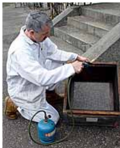
Photo 2: Avant de loger les colonies sur des cires gaufrées exemptes de résidus, il faut gratter et flamber les ruches.

A l'occasion de la reconversion, il est indispensable de gratter et de passer à la flamme les ruches avant d'y loger les abeilles (photo 2). Cela suffit à éviter une recontamination par les résidus contenus dans les parois des ruches 3 . Dans quelques ruchers, les ruches ont en plus été lavées avec de la soude caustique.