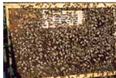
Photo 1: Enfermée dans une cage recouverte d'une grille à reines, la reine peut être nourrie et soignée par les ouvrières.