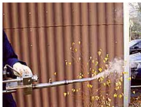
Photo 2: jets puissants d'acide oxalique sublimé grâce au ventilateur

A des fins de comparaison et comme traitement de contrôle, nous avons utilisé l'évaporateur électrique d'acide oxalique Varrox (6) . Dans ce cas-ci, le traitement a eu lieu par l'arrière sous le couvre-fonds grillagé, dans le tiroir à varroas (photo 3).