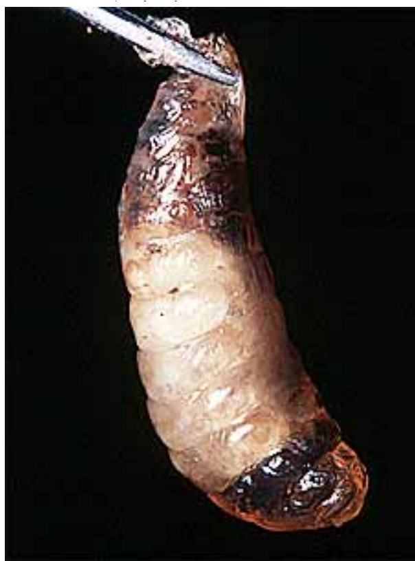
Figure 3. Larve infectée par le virus de la maladie du couvain sacciforme (SBV).