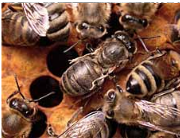
Figure 2. Photographie au microscope électronique- Figure 4. Abeille affectée par la virus de ailes déformées (DWV).

En résumé, la plupart des virus sont présents dans les colonies sous forme d'infection inapparente. Les symptômes observés dépendent de la dose infectieuse, du mode d'infection, du stade de développement de l'abeille et de l'état général de la colonie. Les causes du développement de la