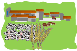
Tableau récapitulatif - 2017