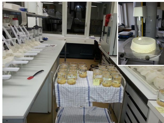
Fig. 1 : Fabrication du tofu dans le nouveau laboratoire de qualité de l'équipe de sélection du soja d'Agroscope.

En 2013, le FiBL, Agroscope et Prokana ont mis en place un essai variétal à Domdidier (FR) et à Reckenholz (ZH). Des lignées CH et étrangères précoces ayant un potentiel alimentaire élevé ont été retenues. Le laboratoire de la qualité de l'équipe de sélection d'Agroscope à Changins a récemment évalué l'aptitude à la transformation de ces différentes obtentions (Fig.1).