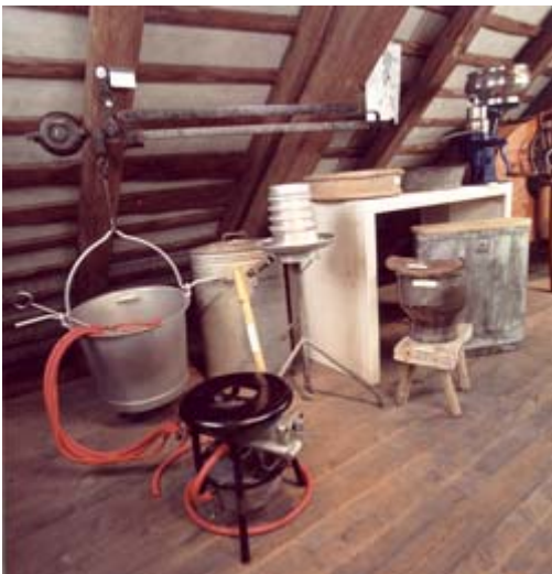
Hat die Erfindung der Handmelkmaschine dannzumal die Gemüter der Handmelker erhitzt?