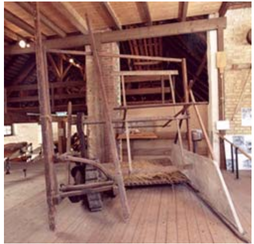
Der Welt erster Getreidemäher war ein wichtiger Schritt in der Mechanisierung der Getreideernte. Im Vergleich zur Handarbeitsstufe benötigt die Herstellung von 1 kg Weizen heute ca. 1000 Mal weniger Arbeitszeit!