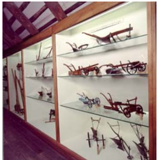
Anstelle von Plänen, welche die Leute früher nicht lesen konnten, dienten massstabtreue Modelle den Handwerkern als „Konstruktionszeichnung“.