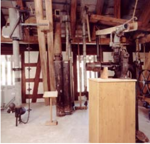
Güllenpumpen aus Holz, angetrieben durch menschliche Kraft lassen manchen Schweisstropfen erahnen. Im Vordergrund Güllenpumpe Luna von Bucher.