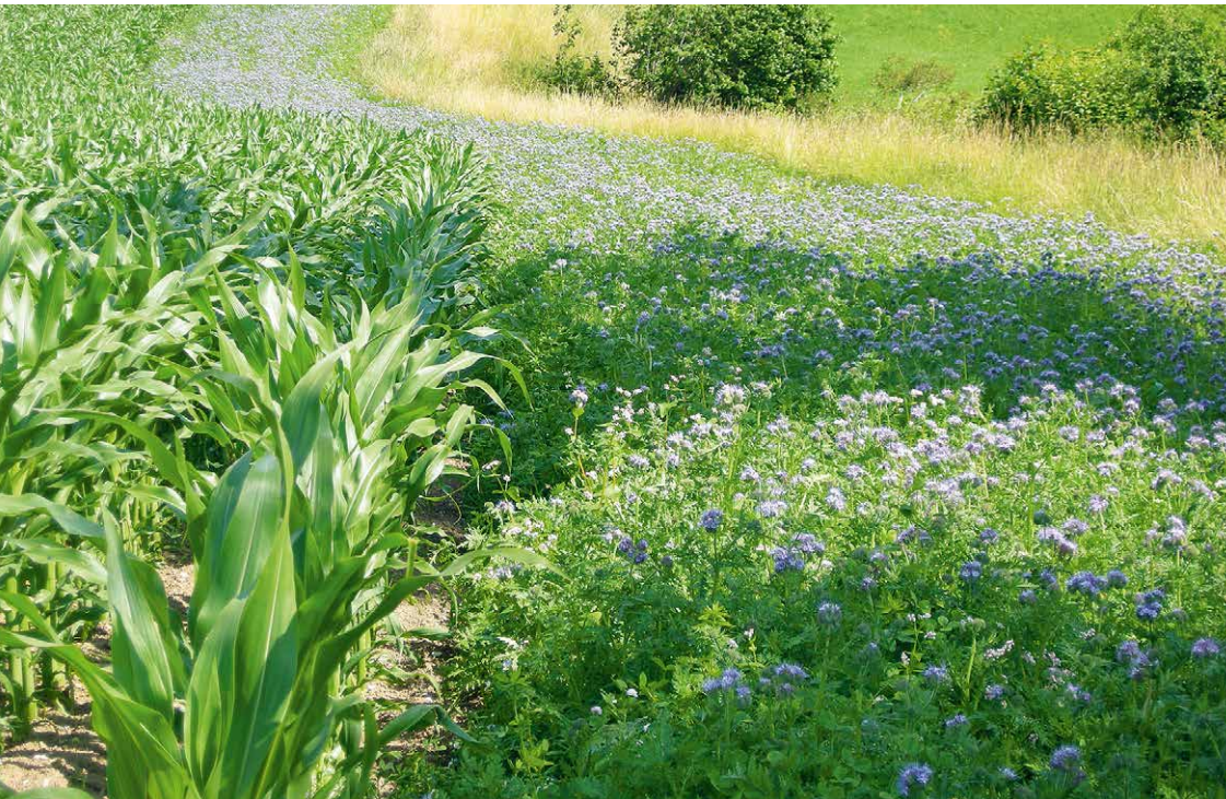
Abb. 1 | Blühende Pflanzen während der trachtarmen Zeit im Sommer sollen Bestäubern und anderen Nützlingen Nahrung bieten: Blühstreifen in der Vollblüte von Phacelia.