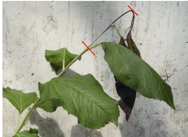
Abb. 3 | Vergleich der Läsionslängen von Alant (links) und Gala.

der Triebe mit einer Suspension des E. amylovora Stamms ACW610 in der Konzentration von 109 cfu/ml auf der Höhe des jüngsten vollentwickelten Blattes. Der Trieb wird dazu mit einer Medizinalspritze durchstochen und ein Tropfen Bakteriensuspension an der Austrittsstelle der Nadel deponiert (Kellerhals et al. 2012).