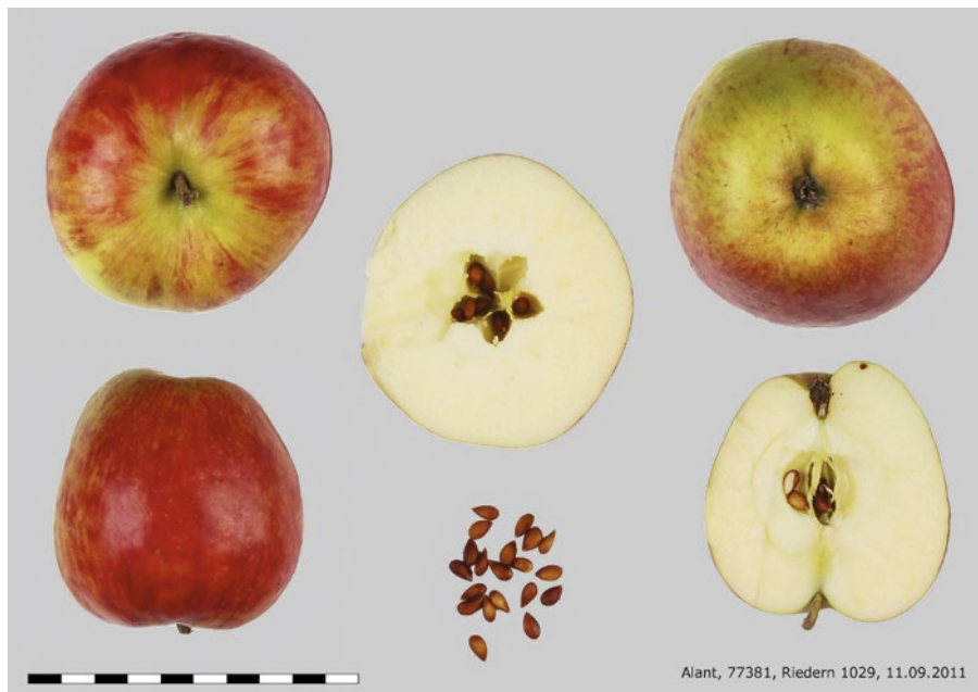
Abb. 2 | Jede morphologische Fruchtbeschreibung wird durch ein Farbfoto mit genau definierten Ansichten ergänzt.