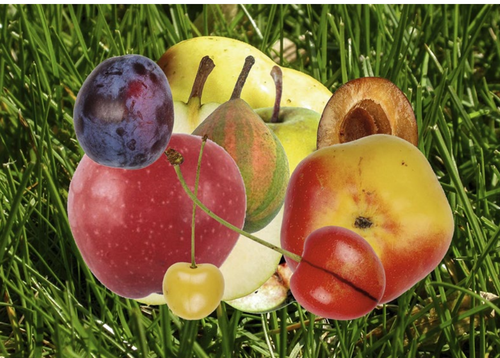
Die Schweiz weist einen grossen Reichtum an Obstgenressourcen auf. (Collage: Kaspar Hunziker)

Auskünfte: Kaspar Hunziker, E-Mail: kaspar.hunziker@acw.admin.ch, Tel. +41 44 783 61 80