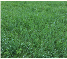
Abb. 1: Gras-Hülsenfrüchte-Mischung sind ebenfalls für die Beweidung verwendbar.