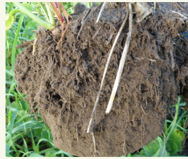
Abb. 2: Wurzelansiedlung im Boden unter einer Gras-Legumen-Mischung.

Mischungen für Zwischenfrüchte und Gründünger sind kommerziell erhältlich und werden oft an den jeweiligen Zweck angepasst. Die Herstellung von Mischungen im Betrieb ist kompliziert. Der Anteil des Saatguts spiegelt nicht den Anteil der Pflanzen wider, sobald die Pflanze vollständig entwickelt ist. Auch die Größe der Samen der verschiedenen Arten, die für eine Mischung verwendet werden, sollte nicht zu sehr variieren, da hier die Tiefe der Aussaat entscheidend ist. Für Gebiete, in denen keine kommerziellen Mischungen zur Verfügung stehen, könnte die Entwicklung dieser Mischungen das Thema einer Arbeitsgemeinschaft sein, d.h. einer Gruppe von Personen, die Wissen zu diesem bestimmten Thema teilen. Der Aufbau einer solchen Praxisgemeinschaft wird durch das Best4Soil-Netzwerk unterstützt, indem ein Workshop zu dem betreffenden Thema organisiert wird. Bei Interesse wenden Sie sich bitte an Best4Soil (Anmeldeformular unter www.best4soil.eu ).