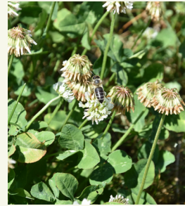
Abb. 3: Weißklee ist eine ausgezeichnete Futterpflanze für Honigbienen.

ge Gruppe von Tieren, denen die Zwischenfrüchte zu Gute kommen, sind Honigbienen und Bestäuber im Allgemeinen (Abb. 3). Die meisten landwirtschaftlichen Kulturen blühen im Frühjahr - Frühsommer. Zwischenfrüchte sind eine ausgezeichnete Möglichkeit, Bienen in der Sommer- und Herbstsaison mit Pollen und Nektar zu versorgen. Hülsenfrüchte, Kreuzblütler, Buchweizen und besonders Phacelien sind ausgezeichnete Pflanzen zur Versorgung der Bienen (Abb. 4). Sie werden oft unter Berücksichtigung des besonderen Ziels der Bienennahrung angebaut.