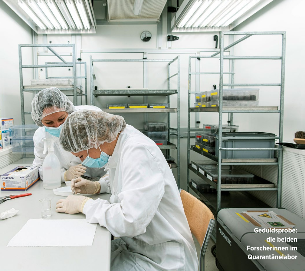
Geduldsprobe: die beiden Forscherinnen im Quarantänelabor