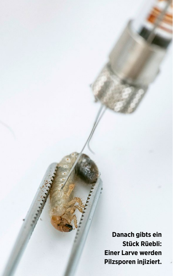
Danach gibts ein Stück Rüebli: Einer Larve werden Pilzsporen injiziert.