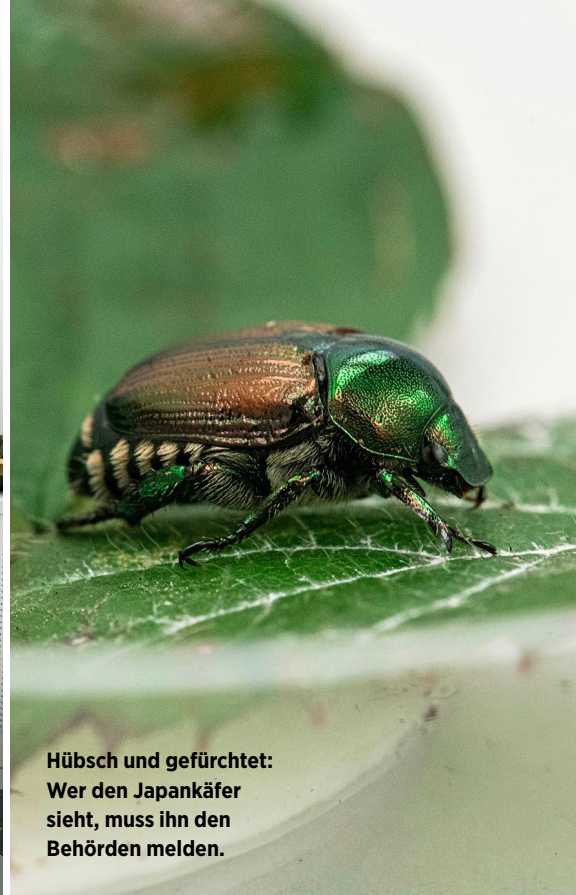
Hübsch und gefürchtet: Wer den Japankäfer sieht, muss ihn den Behörden melden.