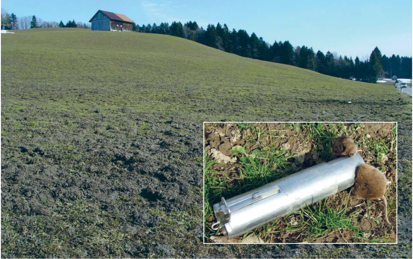
Mäusetotalschaden auf einer Wiese im Kanton St. Gallen und eine der möglichen Bekämpfungsvarianten: die Topcat-Falle.

onszusammenbruch bedeutet sozusagen ein abruptes Ende mit Schrecken. Danach können die Wiesen saniert und die Mäuse für eine Weile vergessen werden.