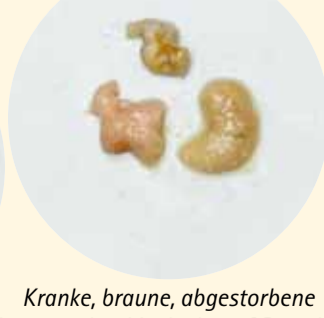
Kranke, braune, abgestorbene Bienenmaden, Verdacht auf Sauerbrut