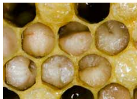
Gequollene Bienenlarven deuten auf Sauerbrut