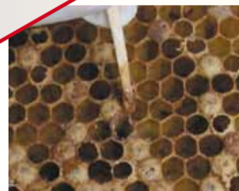
Bei der Sauerbrut reisst der Faden nach 3 mm ab.