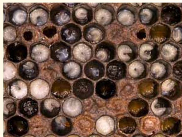
Bei der Faulbrut sind die Brutzellendeckel löchrig und eingesunken.