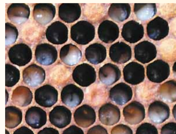
Schlaffe, gequollene, gelblich braune Rundmaden deuten auf Sauerbrut.