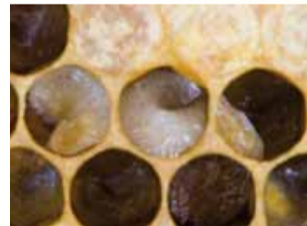
Die Larven verfärben sich gelblich bis bräunlich.