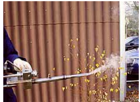
Foto 2: Starker Ausstoss der sublimierten Oxalsäure dank dem Ventilator

Als Vergleichs- und zur Kontrollbehandlung wurde der elektrische Oxalsäureverdampfer Varrox eingesetzt (6) . Hier erfolgte die Behandlung der Bienenvölker von hinten unter dem Gitterboden in der Varroaschublade (Foto. 3).