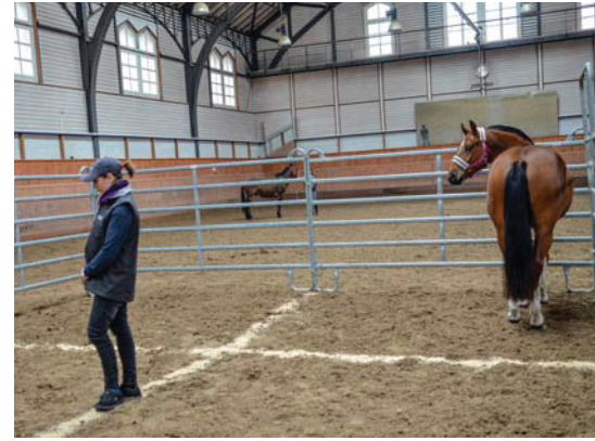
Die Reaktion auf einen unbekanntem Menschen ist einer der Tests, die für das Programm e-FM vorgeschlagen wurden. Le test de réaction à une personne inconnue est un des tests de personnalité qui sera proposé dans le programme e-FM.

Der Freiberger zeichnet sich durch seinen hervorragenden Charakter und seine Vielseitigkeit aus. Dieser goldene Charakter, das Ergebnis einer strengen Selektion, ist heute der Wettbewerbsvorteil der FM gegenüber