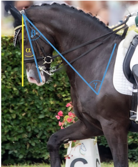
Abbildung 1: Abweichung der Nasenlinie von der Senkrechten ( \alpha ), Genickwinkel ( \beta ), sowie Bugwinkel ( \gamma )

Die Beurteilung des Tierwohls im Pferdesport ist ein aktuelles Thema. Das Ziel dieser Studie war es das Tierwohl im internationalen Spitzen-Dressursport zu untersuchen und zugleich mit den verwendeten Kopf-Hals-Positionen in Bezug zu bringen.