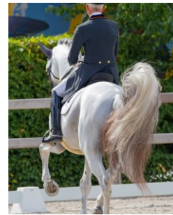
Abbildung 2: Ethologische Indikatoren, die mit Stress in Verbindung stehen, Beispiel: Schweifschlagen (links) und ungewöhnliches orales Verhalten (rechts)