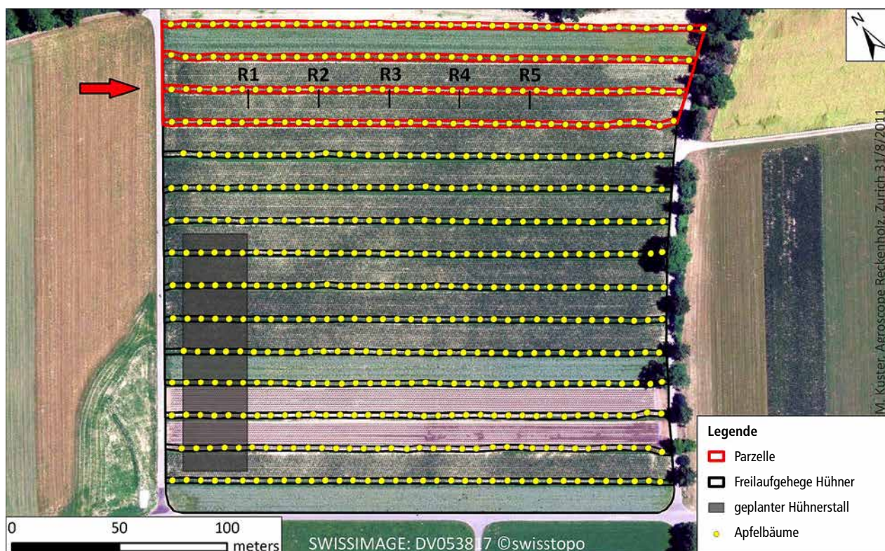
Abb.2 | Luftbild der untersuchten Agroforstparzelle. Die Bodenproben wurden in der dritten Baumreihe und Ackerfläche entnommen (R = Replikat).

Zu unserer Überraschung konnten wir sieben Jahre nach Anlage des Agroforstsystems bereits signifikante Unter-