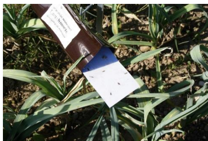
Photo 1: Piège à phéromones pour la surveillance de la teigne du poireau dans les cultures de liliacées.