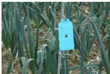
Photo 2: Piège bleu englué de type Rebell® blu pour la surveillance des thrips dans les cultures de liliacées.