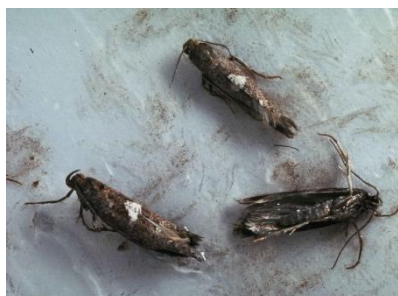
Photo 7: Papillons de la teigne du poireau sur le papier englué d'un piège à phéromones.