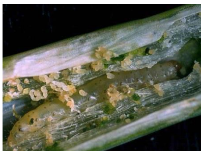
Photo 8: Chenille de la teigne du poireau avec ses crottes dans une feuille tubulaire d'oignon.