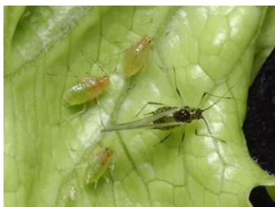
Photo 5: Individu ailé du puceron de la laitue avec trois larves (nymphe) sur une feuille de salade.