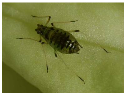
Photo 4: Adulte du puceron de la laitue sur une feuille de salade (photo: H.U. Höpli, Agroscope).