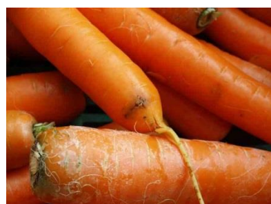
Photo 18: Galerie d'une larve de mouche de la carotte à l'apex d'une carotte.