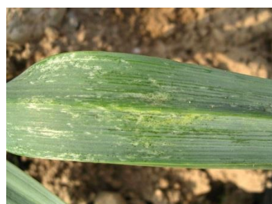
Photo 15: Traces de succion blanc argenté du thrips de l'oignon sur une feuille de poireau.