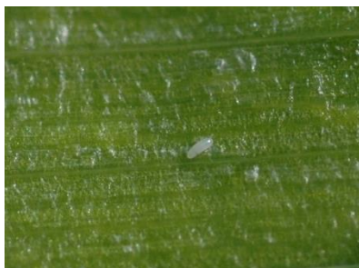
Photo 11: Œuf de la mouche mineuse du poireau à l'intérieur d'une feuille de ciboulette.