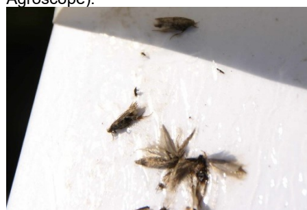
Photo 8 : Début du vol de la teigne de la betterave ( Scrobipalpa ocellatella ). Les chenilles des galeries dans les côtes et pétioles des bettes.