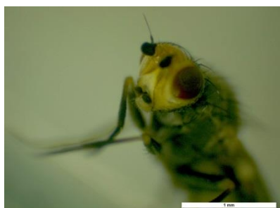
Photo 10: Adulte de la mouche mineuse du poireau.