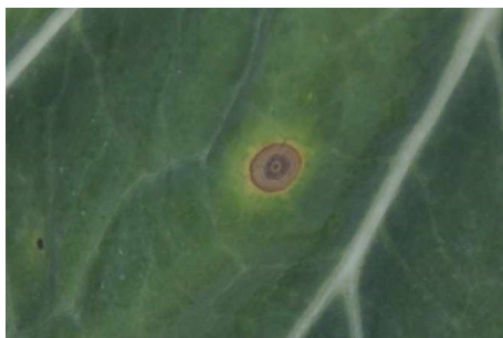
Photo 3 : On voit apparaître maintenant les premières taches de la maladie des taches noires du chou ( Alternaria brassicae ) dans les cultures de choux.