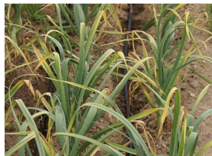
Photo 5 : Dans les cultures d'ail, les pointes jaunissantes des feuilles témoignent de la présence de maladies à taches foliaires, p. ex. Phytophthora porri et Alternaria sp..