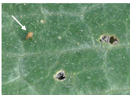
Photo 6 : Collembole ( Sminthuridae ), en haut à g., photo R. Total, Agroscope) sur une feuille de courgette, à côté de ses trous de nutrition,