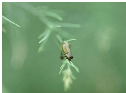
Photo 4 : Les premières larves du criocère de l'asperge ( Crioceris spp.) ont été trouvées sur des asperges vertes lundi, lors du contrôle des cultures.