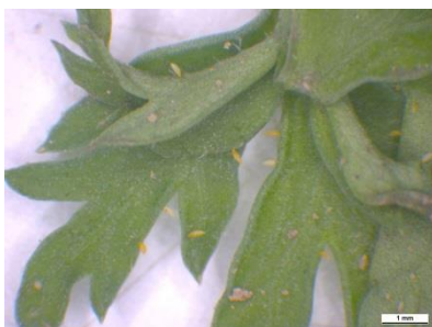
Photo 20: Œufs du psylle de la carotte, orange-jaune en forme de «cactus», sur une feuille de carotte.