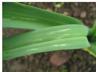
Photo 9: Petites galeries de nutrition de jeunes chenilles de la teigne du poireau sur une feuille de poireau.