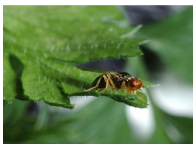
Photo 16: Adulte de mouche de la carotte sur une feuille de carotte.