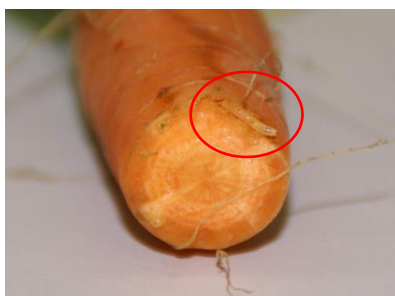
Photo 17: Larve de la mouche de la carotte.