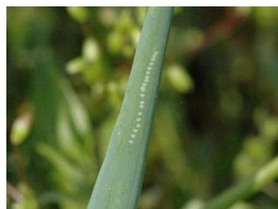
Photo 12: Chapelet de piqûres de succion de la mouche mineuse du poireau à la pointe d'une feuille tubulaire d'oignon.