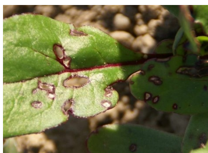
Photo 7 : Dégâts causés par des altises et des collemboles à des semis de betteraves à salade. Contrôlez s'il y a des attaques sur vos semis !