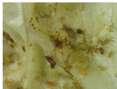
Photo 6: Dégâts de succion du puceron de la laitue et cadavres de pucerons sur une feuille de salade.