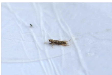
Photo 2 : Une teigne de la tomate a été capturée hier dans le piège que nous avons installé à l'extérieur près de Baden (AG).

Nous avons constaté des changements marqués du comportement et de la dynamique de la teigne de la tomate ( Tuta absoluta ) au cours des dernières années en Suisse. En ce moment, la pression de la teigne est très élevée dans les serres genevoises.