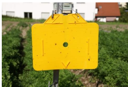
Photo 3: Piège englué orange de type Rebell® orange pour la surveillance de la mouche de la carotte et du psylle de la carotte dans les cultures d'ombellifères.