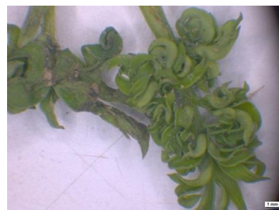
Photo 21: Crispation du feuillage d'une plantule de carotte suite à une attaque de psylles de la carotte.