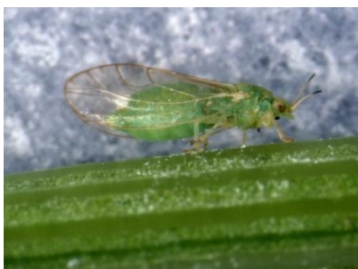
Photo 19: Adulte de psylle de la carotte sur un pétiole de carotte.