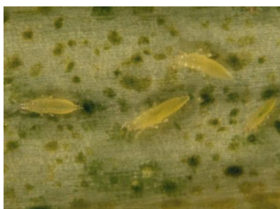
Photo 14: Larves de thrips, jaunes et allongées, sur une feuille d'oignon.