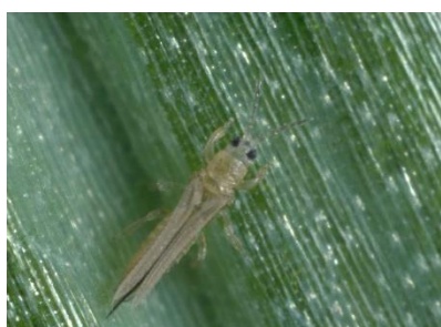
Photo 13: Adulte du thrips de l'oignon sur une feuille d'oignon.