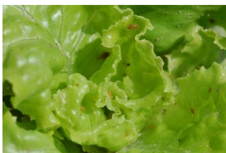
Photo 9 : Le cœur des salades est maintenant attaqué par le puceron de la laitue ( Nasonovia ribisnigri ).