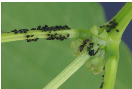
Photo 10 : Chez les haricots, les jeunes tiges et pousses florales sont rapidement colonisées maintenant par le puceron noir de la fève ( Aphis fabae ).