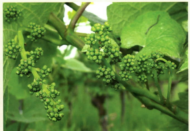
Abb. 2: Stadium 57 am 17.6.2016.