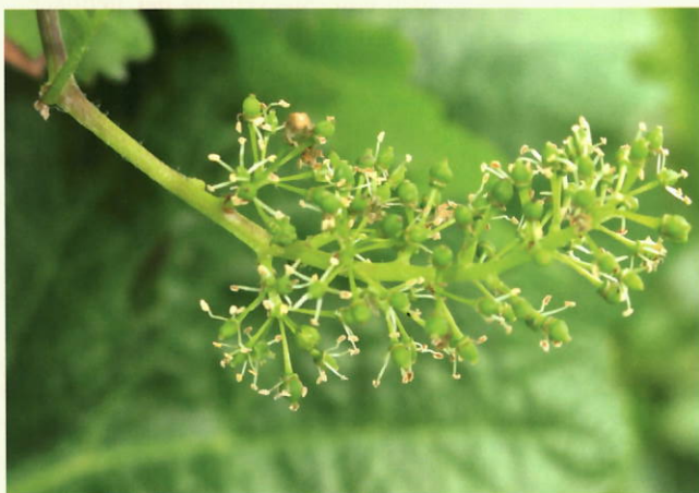
Abb. 1: Stadium 67-69 am 17.6.2015.