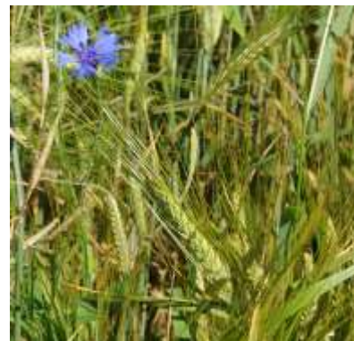
Fig.1 Multiplication des échantillons d'orge au champ à Changins. Les orges ont été récupérées de la banque de gènes nationale à Agroscope et multipliés une fois. Les semences de la deuxième génération de multiplication ont été utilisées dans ce projet.