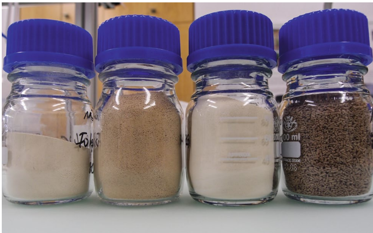
Abb. 3 | Pflanzenschutzmittelkampagne 2011: Vier verschiedene Muster eines Folpet-haltigen Pflanzenschutzmittels. Handelt es sich hier um das gleiche Produkt?

lung der Wirkstoff Cypermethrin eingesetzt wurde (Abb. 2). Solche Befunde sind selten, in diesem Fall lag aber eindeutig eine Täuschung des Endverbrauchers vor. Dieser wollte ein höherwertiges Pflanzenschutzmittel einsetzen, erhielt aber ein Produkt ohne den Mehrwert.