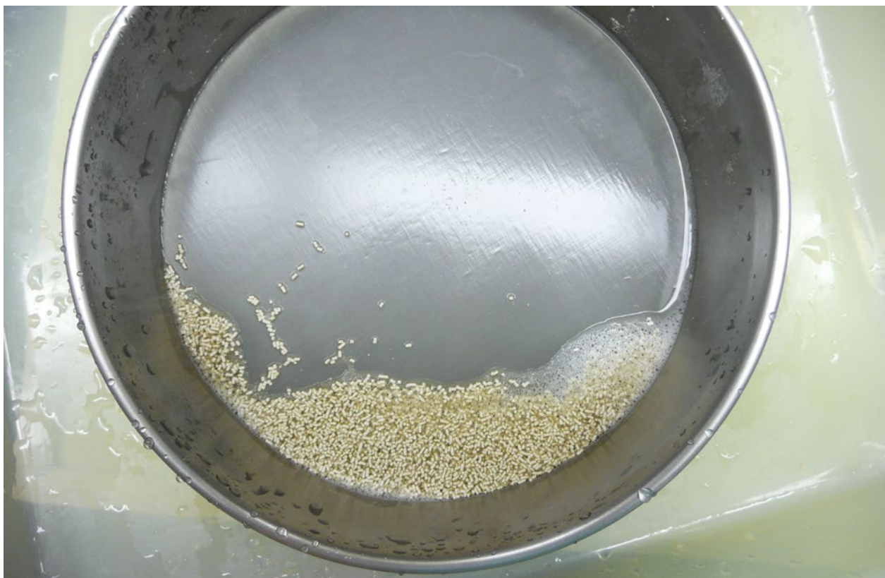
Abb. 5 | Pflanzenschutzmittelkampagne 2011. Rückstände eines Folpet-haltigen Produktes nach Nasssieb-Test.

anstatt der erforderlichen 60 %. Deshalb sind einige Folpet-haltige Produkte nur mit der Auflage zugelassen, dass die Spritzbrühe im Tank regelmässig gerührt wird. Damit wird gewährleistet, dass der Wirkstoff trotz der geringen Stabilität gleichmässig auf die Kultur verteilt wird.