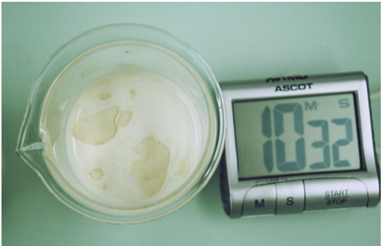
Abb. 4 | Pflanzenschutzmittelkampagne 2011. Benetzbarkeits-Test eines Folpet-haltigen Pflanzenschutzmittels: Sogar nach mehr als zehn Minuten ist das Produkt noch nicht vollständig benetzt.

ches Granulat ist, in der Praxis aber als Pulver verkauft wurde, musste es wegen der gravierenden Abweichung beanstandet werden.