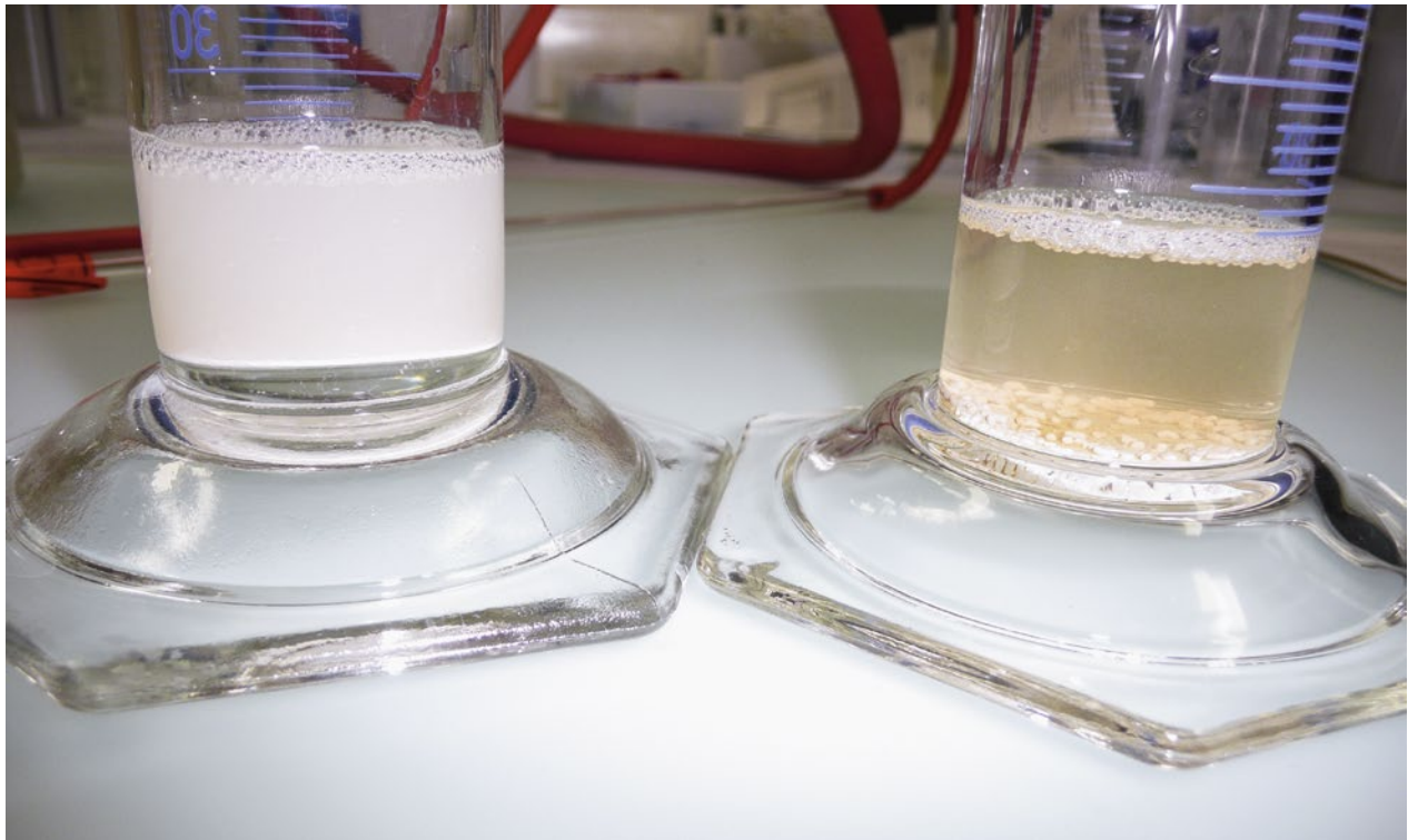
Abb. 6 | Pflanzenschutzmittelkampagne 2011. Suspensionsstabilitäts-Test von zwei Folpet-haltigen Pflanzenschutzmitteln: Das linke Muster zeigt eine gute, das rechte eine ungenügende Suspensionsstabilität, da sich der grösste Teil des Produkts absetzt, anstatt in Suspension zu bleiben.