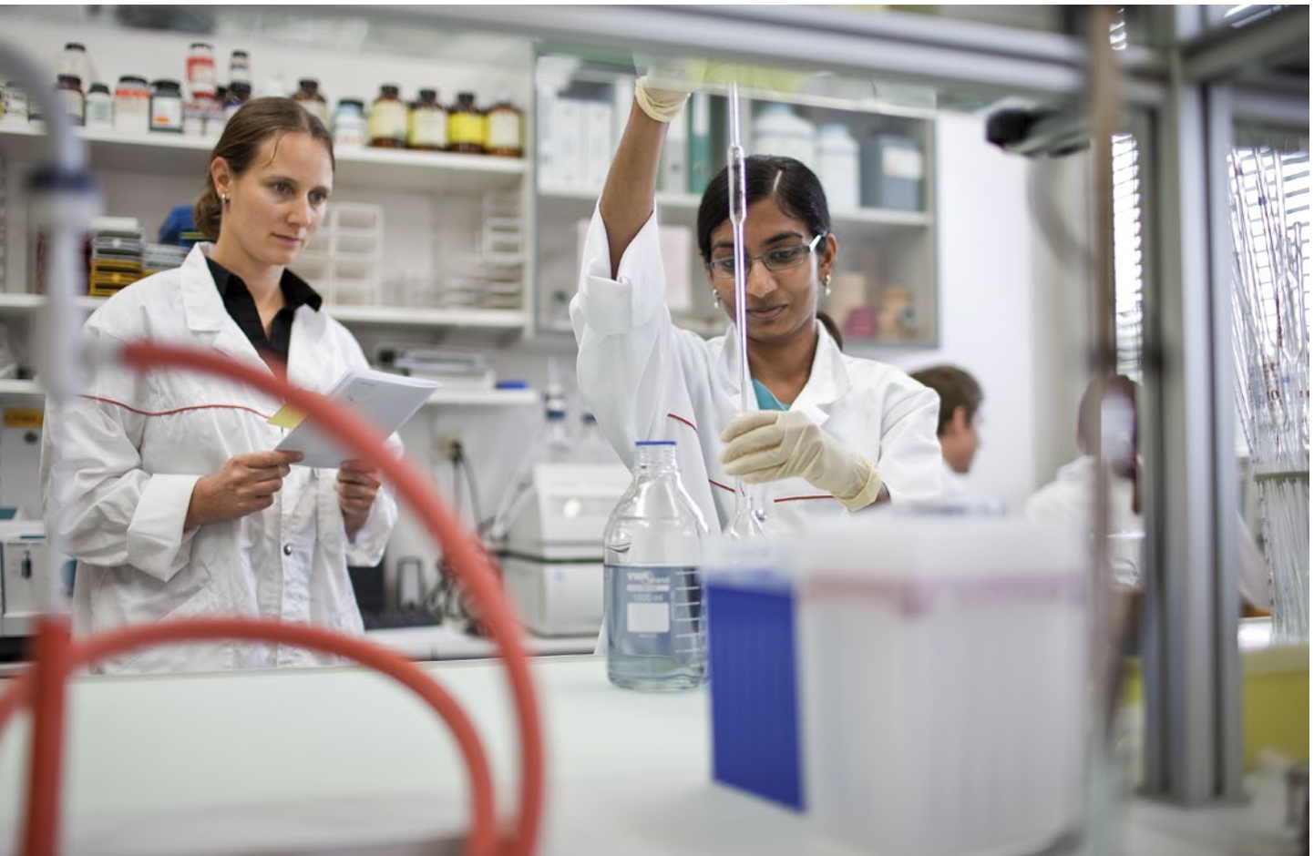
Abb. 1 | Bei den Marktkontrollen von Pflanzenschutzmitteln arbeiten Kantone, BLW und Agroscope eng zusammen. Die Laboruntersuchungen führt die Gruppe Pflanzenschutzchemie bei Agroscope in Wädenswil durch.