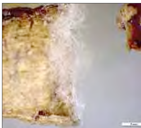
Racine d'asperge verte désinfectée à la surface avec salissure intensive par Fusarium oxysporum sur l'entaille.

Selon les informations provenant de producteurs, les nouvelles plantations d'asperges vertes ne se sont pas développées comme ils l'avaient souhaité. De plus, ces plantations ont souvent été touchées par des maladies, telles Fusarium oxysporum et Phytophthora , provoquant d'importantes pertes. Enfin, la question se posait de savoir si la profondeur de 15 cm à laquelle les asperges sont habituellement plantées permet un départ optimal de la culture