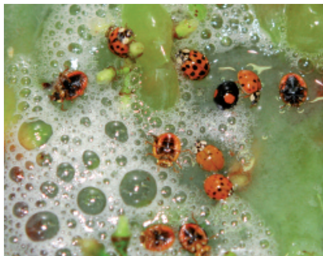
Fig. 1. Adultes de la coccinelle asiatique Harmonia axyridis ajoutés à la vendange de Chasselas.

La coccinelle asiatique Harmonia axyridis Pallas s'est développée de manière spectaculaire ces dernières années en Europe (Brown et al. , 2008). Utilisée avec efficacité comme agent de lutte biologique, cette espèce invasive est également connue pour la pression qu'elle exerce sur la faune indigène, sa capacité à envahir les habitations à l'automne et son impact sur la production de fruits (Koch et Galvan, 2008). Ce dernier point affecte surtout la viticulture. En automne, aux Etats-Unis, H. axyridis s'agrège en masse dans les grappes, cherchant à se nourrir sur les baies mûres et blessées avant de gagner ses lieux d'hivernage. Ce comportement, qui affecte peu le rendement, pose surtout un problème de contamination de la vendange.