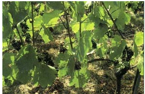
Toute la récolte d'un cep de Gamay détruite par le black-rot.