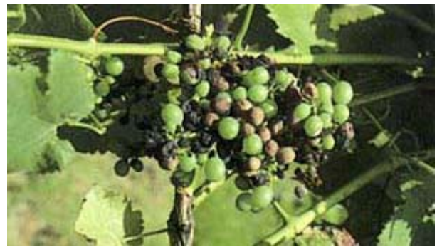
Black-rot sur une grappe de Merlot. Différentes étapes de la progression de la maladie sur les grains.