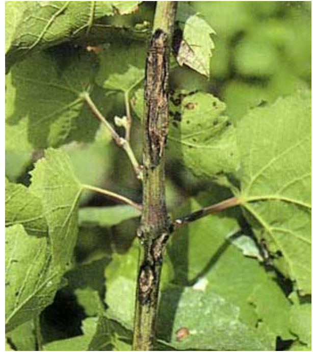
Nécroses sur un sarment de Gamay causées par le black-rot.

Black-rot sur feuille. Les pycnides du champignon, en forme de protubérances noires, sont bien visibles.