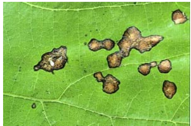
Taches de black-rot sur une feuille de Merlot. Les nécroses sont entourées d'une marge noirâtre.