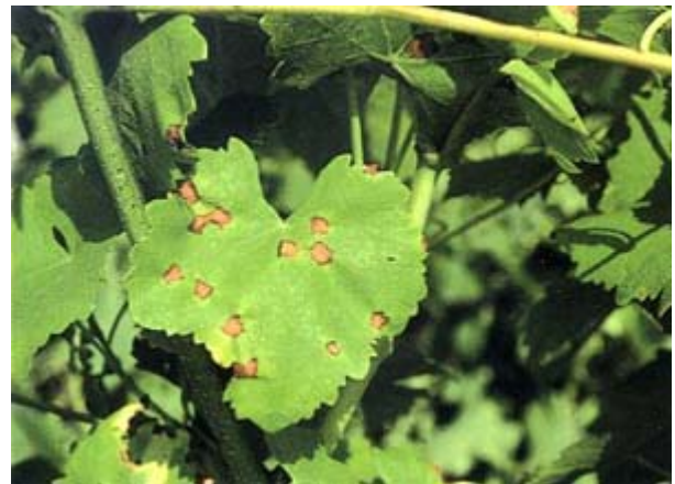
Feuille de Gamay avec taches de black-rot.

Il faut prendre garde aux confusions possibles entre les symptômes déterminés par le black-rot sur des grappes desséchées et ceux du mildiou. Un contrôle rapide de la surface d'un grain malade à l'aide d'une petite loupe permet très facilement de distinguer les fructifications du Guignardia bidwellii , alors que la surface des grains