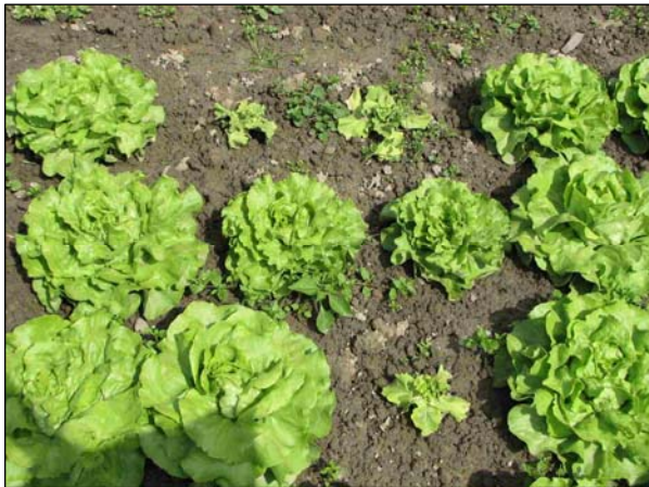
Abbildung 1: Breitadrigkeitsvirus bei Salat: zufällige Verteilung symptomatischer Pflanzen im Feld.

Die Kopfbildung war bei den meisten befallenen Salaten unterdrückt (Abb. 1). Die nicht systematische Verteilung der befallenen Salate im Feld war zunächst rätselhaft. Einzelne Pflanzen zeigten eine deutliche Verbreiterung der Blattadern (Abb. 2), was schliesslich den Verdacht in Richtung Breitadrigkeit lenkte. Die serologische Untersuchung von einigen Pflanzen bestätigte diese Vermutung. Die Pflanzen waren vom Breitadrigkeitsvirus (auch: Adernchlorose, Lettuce Big Vein Virus) befallen. Dieses Virus kann bei Lactuca - und Cichorium -Arten hohe Verluste verursachen.