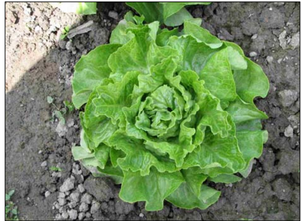
Abbildung 2: Breitadrigkeitsvirus bei Salat: Starrträchtiger Wuchs und Verbreiterung der Blattadern.