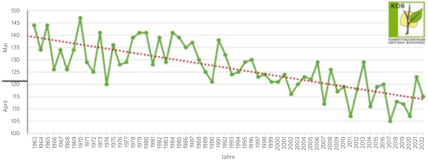
Abb. 1: Vollblüte beim Golden Delicious von 1963 bis 2022 am Standort Bavendorf.

stetig frühere Blütenbildung zu beobachten. Auch in diesem Jahr war dieser Trend am Standort Ravensburg-Bavendorf festzustellen (Abb. 1). Besonders im Falle von Spätfrösten stellt dies Produzenten vor grosse Herausforderungen. In ungünstigen Lagen ist somit durchaus mit frostbedingten optischen Makeln oder unterentwickelten Früchten zu rechnen. Auch wenn in der Bodenseeregion aktuell grössere Fruchtkaliber verglichen zum langjährigen Mittel festgestellt wurden, kann dies eher auf die zu diesem Zeitpunkt verfrühte Fruchtentwicklung zurückgeführt werden. Da der Fruchtbehang sowie das Triebwachstum bei den meisten relevanten Apfelsorten im optimalen Bereich liegen, sind keine übergrossen Früchte zum Zeitpunkt der Ernte zu erwarten, die insbesondere im Lager problematisch werden könnten. Die Mineralstoffversorgung, speziell das Kalium/Calcium-Verhältnis, hat massgeblichen Einfluss auf die Lagerfähigkeit von Äpfeln. Ein ungünstiges Verhältnis bzw. ein Calcium-Mangel kann den Verlust an Festigkeit oder die Bildung verschiedener Lagerkrankheiten fördern. Mit Ausnahme von Elstar liegt die Mineralstoffversorgung der Apfelsorten in dieser Saison in einem guten Bereich (Abb. 2). Einer Langzeitlagerung der Früchte steht somit nichts im Weg. Für eine geplante Langzeitlagerung sind bei Elstar jedoch zusätzliche Calcium-Behandlungen zu empfehlen.