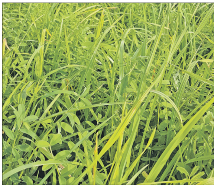
Die Standardmischung 326 vor dem zweiten Schnitt.

POSIEUX Im Jahr 2017 wurde das Angebot im Futterbau um eine Mischung mit Esparsette (Standardmischung 326) ergänzt. Dies, um den Anforderungen im Zusammenhang mit trockenen klimatischen Bedingungen und der Futter- und Proteinautonomie bestmöglich gerecht zu werden. Eine Kunstwiese mit dieser Mischung wurde im Frühjahr 2019 bei Agroscope in Posieux FR angelegt. Es sollten Daten zu den Nährwerten dieser Mischung – durch die Bestimmung der Verdaulichkeit der organischen Substanz (vOS) mit Schafen (Referenzmethode) – sowie zum Ertrag und zur botanischen Zusammensetzung unter praxisähnlichen Bedingungen gesammelt werden.