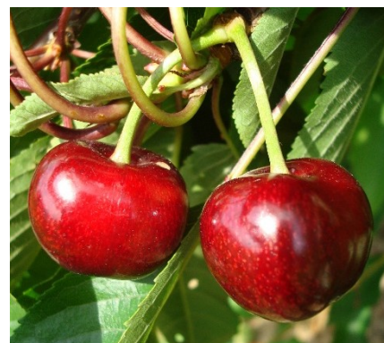
Typische rundlich-ovale Fruchtform von Bedel.

Bedel (Bellise®) ist eine interessante Kirsche im frühen Reifesegment. Die Sorte überzeugt vorrangig mit ansprechender Optik, akzeptabler Festigkeit, guter Fruchtgrösse und regelmässigen Erträgen. Die Fruchtqualität wird nur erreicht, wenn der Behang konsequent mittels Fruchtholzschnitt reguliert wird. Bedel muss zwingend unter Abdeckung und Vogelnetz angebaut werden.