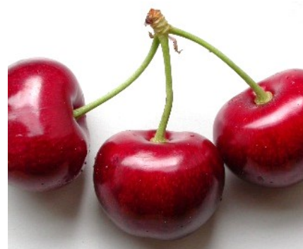
Die kurzen Stiele von Bedel können die Ernte erschweren.