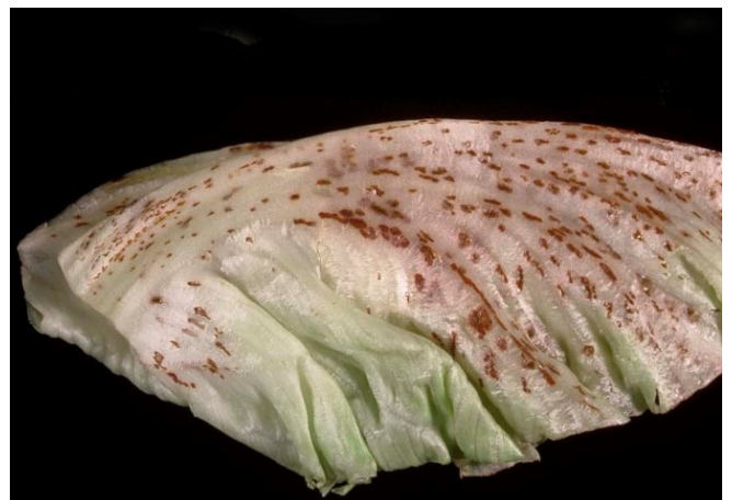
Abbildungen 15 und 16: Verschiedene Stadien von Tüpfelbräune / Russet Spotting.