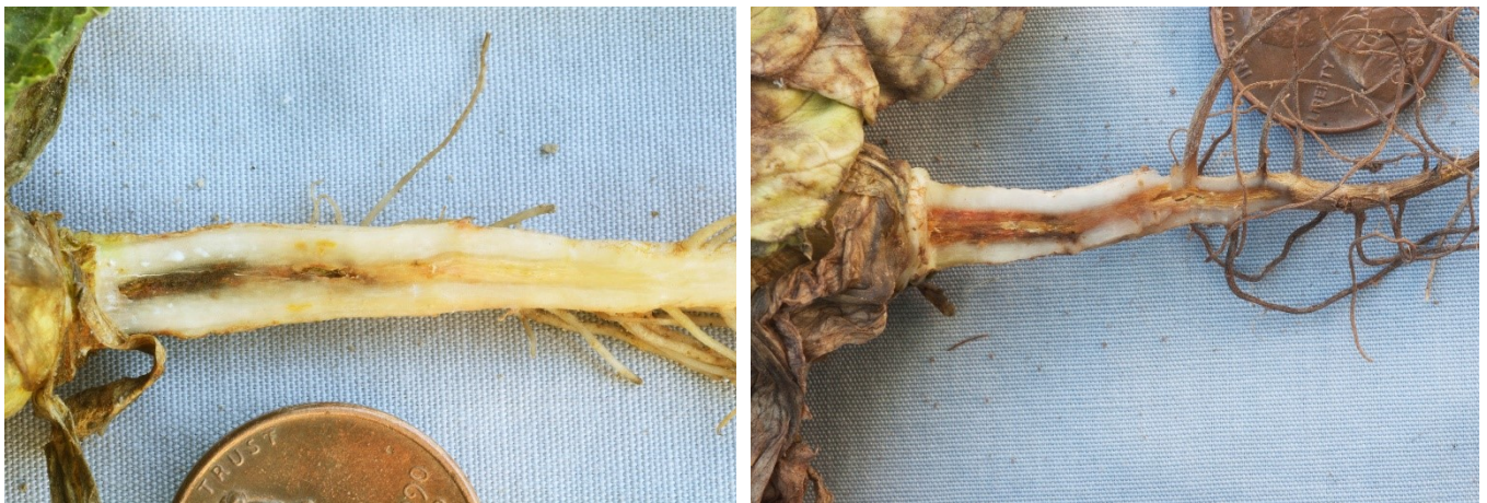
Abbildungen 11 und 12: Verschiedene Stadien der Wurzelschädigung durch Ammonium.

Durch Ammonium verursachte Vergiftungserscheinungen sind am häufigsten bei Jungpflanzen und im Frühjahr zu beobachten 12 . Die Blätter sind glanzlos, dunkel- bis graugrün und zeigen vorübergehende Welkeerscheinungen zur warmen Tageszeit 13 . Später werden die Blattränder braun und die Pflanze bleibt im Wachstum zurück, verkümmert oder geht im Extremfall ein 12 . Die Wurzeln werden geschädigt und damit die Wasserversorgung der oberirdischen Pflanzenteile beeinträchtigt 12 . Teilweise werden die Wurzeln rötlich 10 und die Wurzelhaare und kleine Seitenwurzeln sterben ab. Wird die äusserlich noch gesunde Hauptwurzel längs aufgeschnitten, zeigt sich eine rötlich-braune Verfärbung und weiches, nekrotisches Gewebe im Zentrum 12,13,14 (Abb. 11, 12). Schreitet die Krankheit fort, entsteht im Innern der Hauptwurzel ein Hohlraum. Das äussere Gewebe der grösseren Wurzeln kann aufplatzen und verkorken 12 . Charakteristisch für Ammoniumvergiftungen sind die zufällig über das Feld verteilten geschädigten Pflanzen, die selten in Gruppen stehen 14 . Von Ammonium verursachte Schäden werden leicht mit den Symptomen von bodenbürtigen Krankheiten verwechselt. Diese treten jedoch vorwiegend nesterweise auf 14 .