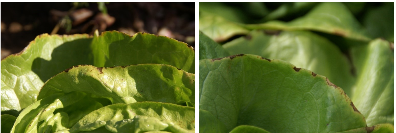
Abbildungen 5 und 6: Trockenrand.

Der Rand älterer Blätter wird braun oder bekommt braune Flecken (Abb. 5, 6).