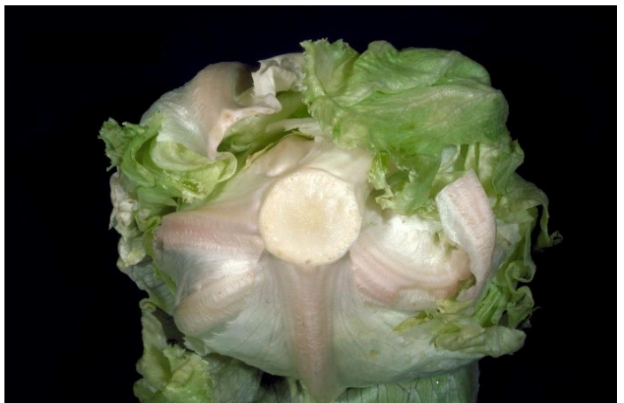
Abbildung 20: Pink Rib an Eissalat (Foto: Adel Kader, University of California, Davis).