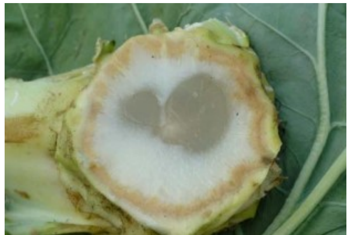
Abbildung 8: Glasigkeit im Strunk (hier an Kohl).