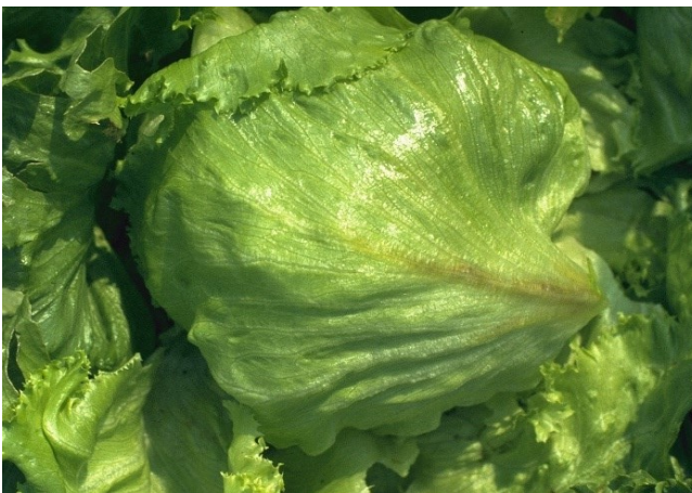
Abbildung 19: Blattrippenverfärbung.

Blattrippenverfärbung (Abb. 19) tritt üblicherweise ganz am Ende der Kulturdauer besonders bei Eisberg auf und kann den Salat innert Kürze unverkäuflich machen. Gefährlich sind vor allem Perioden mit heissen Tagen und warmen Nächten. Es empfiehlt sich, die Bestände bei solchen Bedingungen regelmässig zu kontrollieren und wenn nötig, so rasch als möglich abzuernten. Die physiologische Störung «Pink Rib» ist ein Zeichen für überreife Köpfe. Die Mittelrippen nehmen dabei eine nicht klar begrenzte, rosa Farbe an, welche sich während dem Transport und der Lagerung auf die kleineren Blattadern ausdehnt 1,19 (Abb. 20).