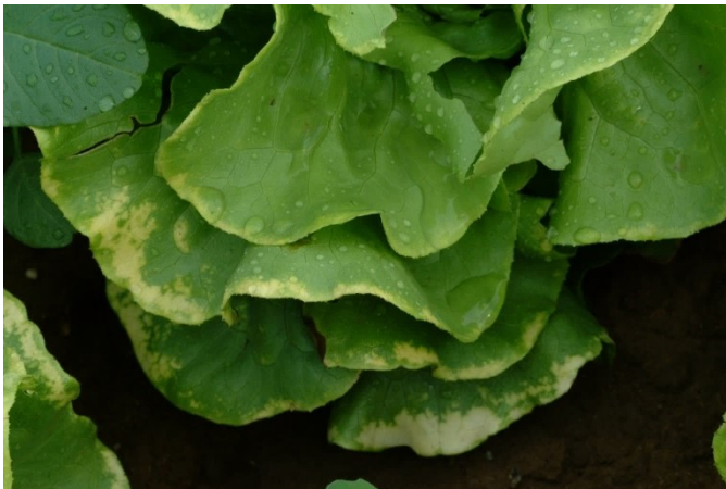
Abbildungen 13 und 14: Durch Manganüberschuss hervorgerufene Symptome an Kopfsalat.