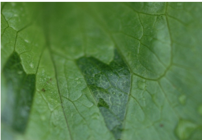
Abbildung 7: Durch Blattadern begrenzte glasige Stelle.

Typischerweise treten die durchscheinenden, oft dunklen Ölflecken an Blatträndern auf. Die glasigen Stellen sind meist durch die Blattadern begrenzt (Abb. 7) 11 . Vor allem bodennahe Blätter sind betroffen. Glasigkeit kann auch im Strunk auftreten was bei der Ernte leicht zu erkennen ist (Abb. 8). Davon betroffene Salate faulen innerhalb kurzer Zeit 11 . Bereits Keimlinge können Glasigkeit entwickeln. Sie werden dunkelgrün und bleiben im Wachstum zurück 11 . Obwohl reversibel, darf das Phänomen nicht unterschätzt werden. Ein massiver Schaden bis zum Totalverlust ist möglich, wenn über die glasigen Stellen Bakterien und Pilze ins Gewebe eindringen (Abb. 9).