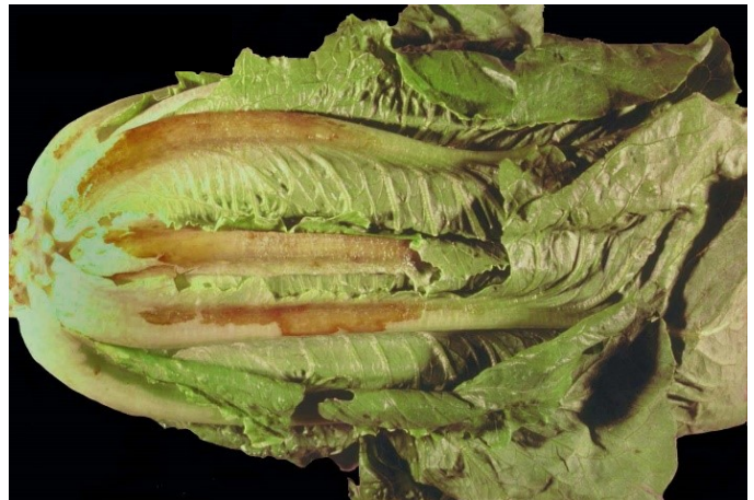
Abbildungen 17 und 18: Braune Flecken an Eissalat und Lattich.