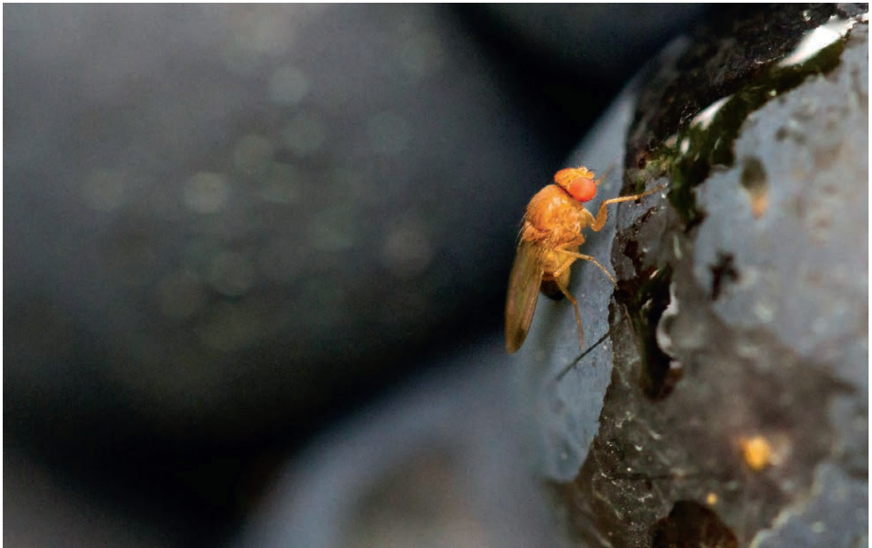
Figure 1 | Mâle de la drosophile du cerisier sur une baie de raisin.

Renseignements: Christian Linder, tél. +41 58 460 43 89, e-mail: christian.linder@agroscope.admin.ch, www.agroscope.ch