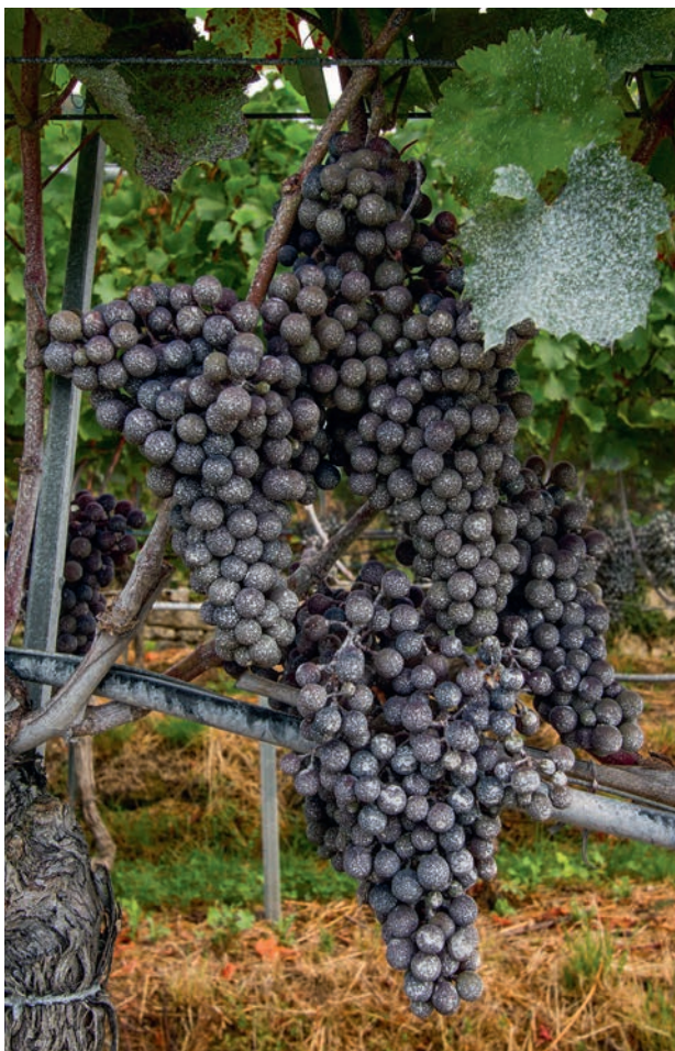
Figure 2 | Grappes traitées au kaolin.

non publiées) et les parasitoïdes (Pease et al. 2016) reste négligeable. Néanmoins, l'influence de multiples applications de kaolin réalisées juste avant les vendanges sur la composition chimique et organoleptique des vins produits est peu documentée (par exemple Coniberti et al. 2013). Bien que le kaolin soit également utilisé comme agent de collage, il contient de l'aluminium, dont la présence dans la chaîne alimentaire soulève de nombreuses interrogations sur la santé humaine (par exemple Stahl et al. 2017). Cet article se base sur une publication scientifique récente (Linder et al. 2020) et présente une synthèse de nos derniers résultats sur l'efficacité du kaolin contre D. suzukii , ainsi que sur son impact sur les paramètres chimiques et sensoriels des vins issus de raisins traités au kaolin.