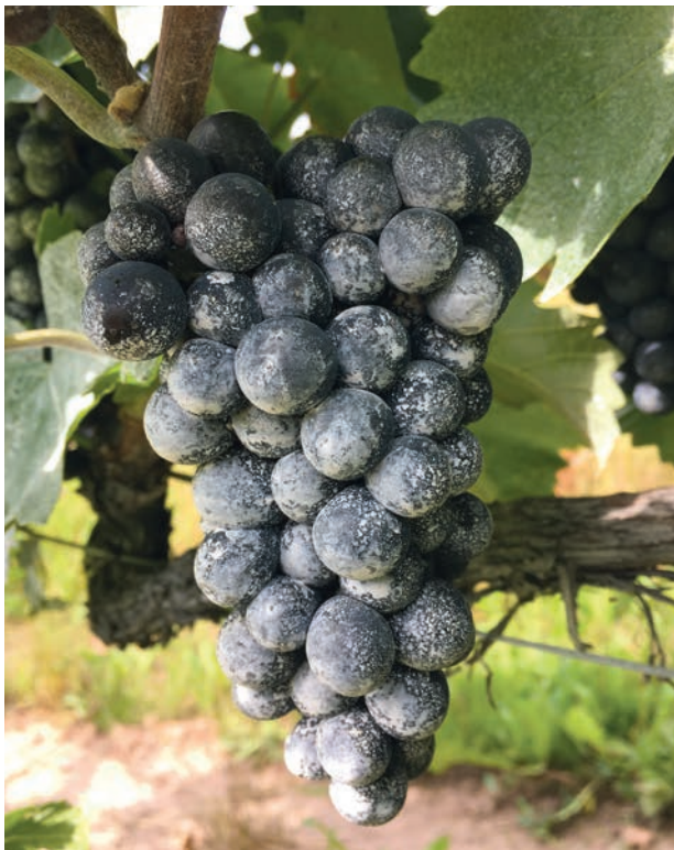
Figure 4 | Une couverture optimale des grappes (à gauche) est préférable à une couverture partielle (à droite) pour assurer la résistance à la pluie et l'efficacité contre D. suzukii .

témoins non traités ont varié de 0% à 69% (tabl. 1 et fig. 3). L'efficacité des applications de kaolin a ainsi varié de 0% à 100%. En moyenne, les traitements ont significativement réduit la ponte de D. suzukii par rapport au témoin non traité ( W = 5,5 , P < 0,001 ). Cependant, la dose appliquée ne semble pas avoir d'influence et aucune différence significative n'a pu être observée entre les applications de kaolin à 1% et 2%, avec une efficacité respective de 56,8% et 57,1% ( U = 55 , P = 0,97 ), comparable à celle obtenue avec des insecticides classiques. Dans l'ensemble, la stratégie préventive (69,4% d'efficacité) a eu tendance à être plus efficace que la stratégie curative (34,5%) ( U = 32,5 , P = 0,054 ). Toutefois, cette différence n'est plus vérifiée lorsque seuls les essais à 2% de kaolin sont pris en compte: 67,4% pour la stratégie préventive, contre 50,3% pour la curative ( U = 21,5 , P = 0,31 , tabl. 1). D'un point de vue pratique et malgré une efficacité similaire, la concentration de 2% semble plus appropriée, puisqu'elle assure une meilleure adhérence après la pluie (fig. 4) et donc une plus grande persistance sur les raisins. Il semble également approprié d'attendre que les premiers œufs de D. suzukii soient observés dans la région et sur un cépage de sensibilité similaire pour appliquer le premier traitement. Cela pour éviter des applications systématiques de kaolin à la véraison.