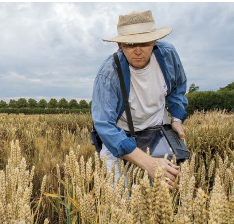
Abb. 1 | Die Züchterinnen und Züchter von Agroscope achten auf eine hohe Krankheitsresistenz ihrer Sorten.

Auskünfte: Peter Stamp, E-Mail: peter.stamp@usys.ethz.ch