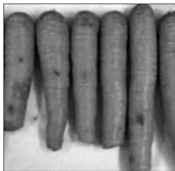
Abb. 1. Karotten nach Standardwaschverfahren (links) und nach zusätzlicher Spülung (rechts).