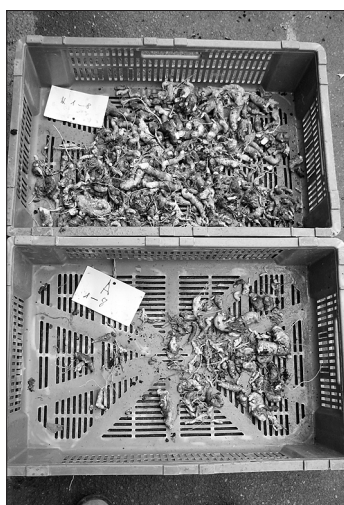
Gesammelte Hernien von je 48 Pflanzen aus der Agrobiosol-Parzelle (unten) und der Kontrollparzelle (oben).

ben Anzahl Pflanzen aus der Biosol-Parzelle dagegen nur 1300 g, was ei-