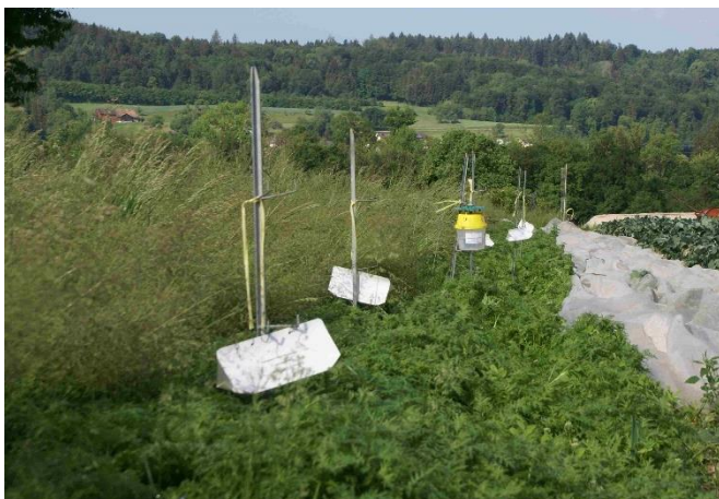
Foto 9: Foto 9: dal 2020 la trappola a feromoni per il monitoraggio dell'elotide del cotone viene posizionata sul bordo di una parcella orticola.

Le somme delle catture nel corso di una stagione in parcella situata nei pressi di Baden (AG) per gli anni 2017 fino al 2023 dimostrano un'aumentata attività di volo dell'elotide del cotone con in totale 46 falene catturate nel 2022 e 52 nel 2023 (immagine. 1, p. 4).