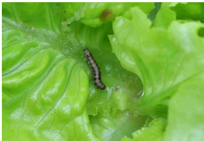
Foto 5: bruco di mezza età dell'elotide del cotone su lattuga.

I bruchi effettuano da 5 a 7 stadi circa. I primi due stadi si nutrono inizialmente delle foglie (foto 4). A partire dal terzo stadio vengono preferiti parti della pianta generative quali, p.es., baccelli e frutti. Gli stadi più vecchi sono i più voraci e causano importanti danni. I bruchi dello stadio larvale medio sono appariscenti a causa della presenza di strisce simmetriche marroni longitudinali sulla schiena e hanno protuberanze e gambe scure. (foto 5).