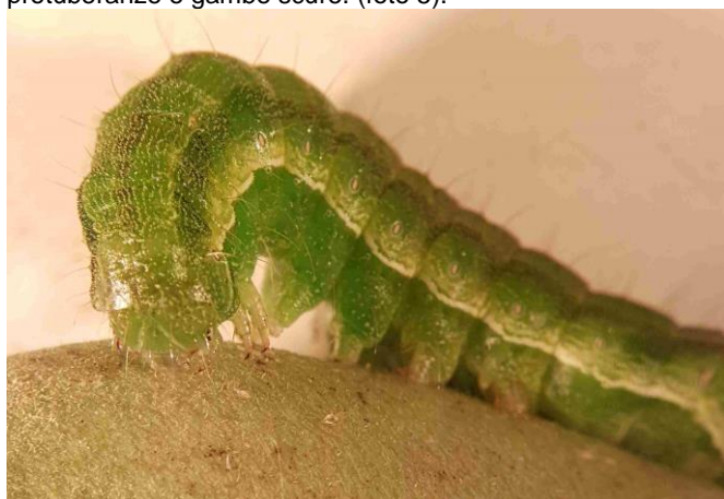
Foto 6: bruco più vecchio dell'elotide del cotone mentre si nutre su un baccello di fagiolino. Sono visibili le fini linee longitudinali.

I bruchi effettuano da 5 a 7 stadi circa. I primi due stadi si nutrono inizialmente delle foglie (foto 4). A partire dal terzo stadio vengono preferiti parti della pianta generative quali, p.es., baccelli e frutti. Gli stadi più vecchi sono i più voraci e causano importanti danni. I bruchi dello stadio larvale medio sono appariscenti a causa della presenza di strisce simmetriche marroni longitudinali sulla schiena e hanno protuberanze e gambe scure. (foto 5).