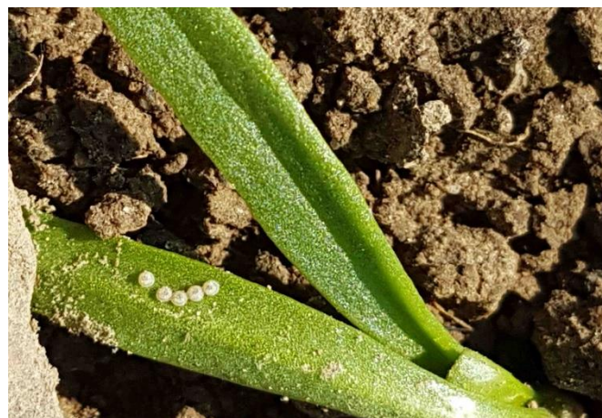
Foto 3: ovideposizione di una nottua (Noctuidae) su foglioline di spinacio.

L'elotide del cotone è di un colore che va dal beige al marrone chiaro e presenta un'apertura alare di 3,5-4 cm. Le ali anteriori presentano ognuna un puntino marrone sopra una fascia grigio-beige (foto 1). Anche sulle ali posteriori è visibile una fascia scura (foto 2).