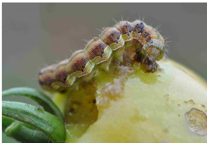
Foto 7: bruco colorato dell'elotide del cotone su pomodoro. Il bruco presenta delle verruche accanto stigmi.

Gli stadi più vecchi sono ricoperti da fitte linee fini bianche. Sono, inoltre, di un colore molto variabile oppure a fasce, da