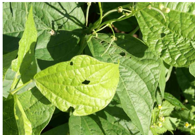
Foto 4: danni causati dall'elotide del cotone su foglie di fagiolino.

L'elotide del cotone ha un elevato potenziale dannoso. Le femmine risultano essere molto feconde e possono deporre 1'000-3'000 uova per individuo. L'ovodeposizione, singola o in piccoli gruppi, avviene sulle foglie delle piante ospiti (vedi foto 3).