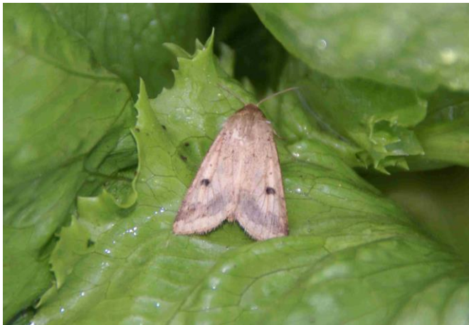
Foto 1: falena dell'elotide del cotone, anche nota come nottua del pomodoro, su insalata iceberg. La falena, presenta i due caratteristici punti scuri e la fascia più ampia grigiastra all'estremità.

L'elotide del cotone, anche nota come nottua del pomodoro ( Helicoverpa armigera ) è una specie termofila e polifaga che proviene originariamente dai tropici. In quanto falena migratoria è in grado di superare lunghe distanze, superiori ai 1000 km, e anche grandi dislivelli come passi alpini. A causa del riscaldamento globale in estate avanza dal Nord Africa fino all'Europa settentrionale. Questa crescente diffusione è stata osservata anche in Svizzera sull'arco di diversi anni. Se negli anni 80 l'elotide del cotone veniva regolarmente trovata in Ticino, negli anni 90 si aggiunsero ritrovamenti nella Svizzera romanda e durante l'estate del 2003 si aggiunse l'infestazione rilevata nella valle della Reuss.