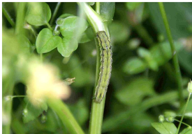
Foto 8: nell'ottobre del 2023 erano ancora presenti dei bruchi dell'elotide del cotone su fagiolino (foto: Agroscope).

giallo-verde fino a arancione-marrone (foto 6 + 7). Una parte degli individui presenta, al di sopra degli stigmi, delle vistose verruche nere ricoperte di setole e anche altre macchie nere sul corpo, p.es. sul quarto segmento. L'ultimo stadio misura circa 4 cm e abbandona la pianta in direzione del suolo dove successivamente si impupa.