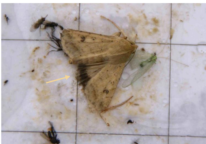
Foto 2: falena catturata in una trappola a feromoni. Sull'estremità posteriore è visibile la fascia scura presente sulle foglie posteriori (vedi freccia su foto di Agroscope).

Oggi giorno la nottua del pomodoro è presente in tutta la Svizzera. Le prime nottue migrate sono state catturate con trappole a feromoni a nord delle Alpi a partire da giugno o