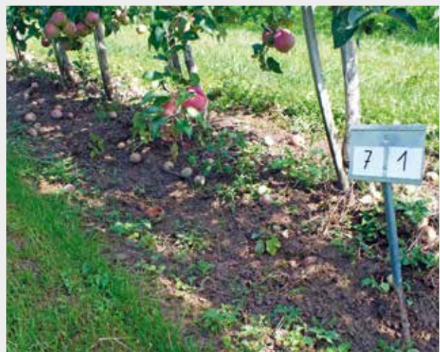
Figure 3 | Herbicide et disque émotteur et étoile bineuse: formation d'une butte due au passage de l'étoile bineuse dans la zone entre les arbres.