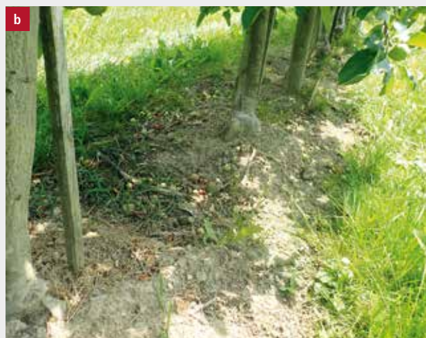
Figure 4 | a) L'acide pélargonique n'a aucun effet sur les mauvaises herbes de plus de 10 cm; b) Vorox (non autorisé en Suisse) et Natrel appliqués à la mi-avril, photo prise début juillet.