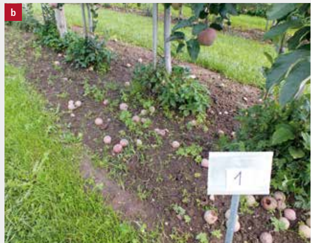
Figure 1 | a) Emotteuse: bons résultats et finitions propres par rapport à la voie de passage; b) le passage de l'émotteuse à lui seul ne permet pas de désherber correctement la zone proche du tronc lorsque les touffes d'adventices sont bien établies.