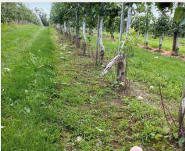
Figure 2 | Herbicide et éclaircisseuse à fils de nylon rotatifs: l'éclaircisseuse à fils de nylon rotatifs permet un degré de couverture permanent.