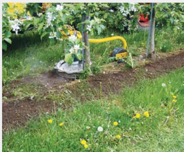
Figure 5 | L'effet du Grasskiller est limité à la largeur de travail de la machine. Un autre inconvénient de cette technique est qu'elle est peu efficace sur les mauvaises herbes proches du tronc et sur les rejets de souches.

contrôler comme l'égopode podagraire ou le pâturin annuel n'ont pas pu être suffisamment maîtrisées à l'aide de l'acide pélargonique (fig. 4a). Un effet plus durable n'a pu être obtenu qu'en combinaison avec d'autres substances actives et avec une application précoce (fig. 4b).