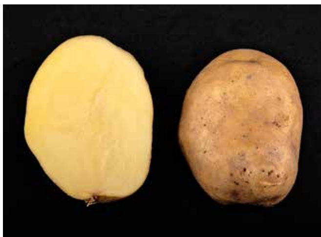
Figure 1 | Acoustic est une variété de consommation de type culinaire B avec un bon potentiel de rendement. Acoustic a été sélectionnée par la maison Meijer aux Pays-Bas. Cette variété a une très bonne résistance au mildiou du feuillage et nécessite moins de traitements fongiques durant la période de végétation. Elle est de forme oblongue courte à ronde et moyennement sensible aux autres maladies.

Une variété peut se situer entre deux types culinaires: la première lettre indique alors le type culinaire prédominant. Par exemple, une pomme de terre de type culinaire B-C est moins farineuse et plus ferme qu'une autre de type C-B.