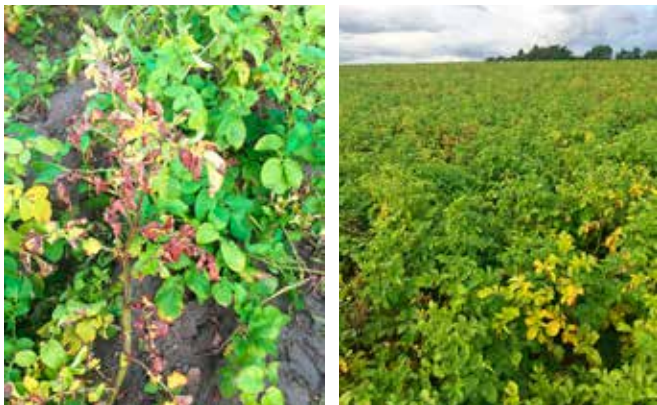
Figure 3 | La verticilliose ( Verticillium spp.) et la dartoïse ( Colletotrichum coccodes ) peuvent se développer après une période très chaude et sèche. Les deux maladies peuvent se manifester simultanément sur la même plante. Ces champignons sont présents dans le sol et contaminent les plantes par les racines et les tiges. Dans ce champ d'Agria, quelques plantes ont jauni prématurément en août et ont ensuite dépéri. Le nombre de plantes atteintes peut s'accroître rapidement au niveau de la parcelle.

En 2017 déjà, quelques cultures avaient jauni ou bruni prématurément (fig. 3). Une moitié du feuillage avait flétri et s'était desséchée sur quelques plantes. Les jours suivants, le phénomène s'était propagé à d'autres plantes dans la parcelle. Dans ces cultures, le calibre souhaité n'était malheureusement pas encore atteint, malgré un arrosage suffisant. Après diagnostic en laboratoire, les agents responsables de la verticilliose ( Verticillium spp.) et de la dartoïse ( Colletotrichum coccodes ) ont pu être identifiés. Ces deux maladies peuvent se manifester séparément ou simultanément.