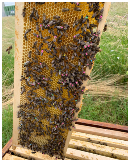
Abeilles marquées par un code couleur correspondant à l'exposition au Coumaphos dans la cire

Pendant le développement du couvain, les abeilles ont été exposées à des résidus de coumaphos réalistes dans la cire d'abeille. Le Coumaphos est une matière active autorisée contre l'acarien varroa en Suisse. Les abeilles fraîchement écloses exposées au Coumaphos ont été marquées et traitées au stade de butineuse avec une dose sublétales de Thiamethoxam.