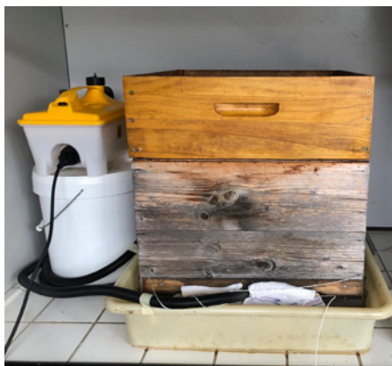
Un appareil de production de vapeur d'eau utilisé communément pour fondre la cire a été utilisé pour désinfecter des planchettes de bois infectées par des bactéries de loque européenne dans un corps de ruche.

A l'instar de la méthode développée par Agroscope pour stériliser de manière simple le matériel dans les fromageries d'alpage, nous avons testé l'utilisation de vapeur d'eau pour la décontamination du matériel apicole exposé à Melissococcus plutonius . Ce travail réalisé dans le cadre d'un stage de master par Aline Marcionetti-Rusconi a porté ses fruits et cette méthode semble offrir une nouvelle possibilité pour la désinfection. Nous allons répéter ces expériences dans des conditions plus représentatives du terrain pour confirmer ces premiers résultats encourageants.