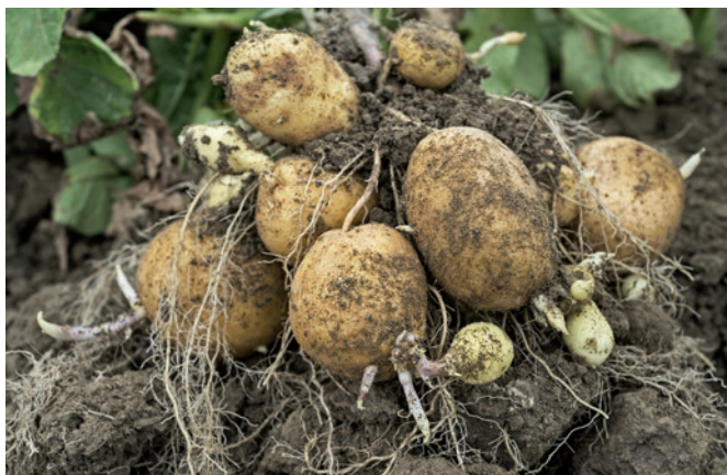
Abb. 2 | Bildung einer zweiten Knollengeneration Ende Juli 2015 bei der Sorte Agria in Goumoëns-la-Ville.

Die Sorten Bintje und Agria bildeten eine zweite Generation von Knollen aus (Abb. 2). Désirée, Amandine, Markies, Annabelle, Ditta, Lady Felicia und Verdi keimten stark im Boden (Abb. 3) und bildeten teilweise ebenfalls eine zweite Knollengeneration. Sorten, die eine solche Reaktion zeigen, verlieren ihre Konsistenz und leiden unter klaren Qualitätseinbußen.