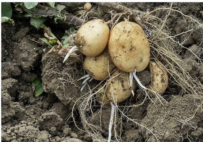
Abb. 3 | Erneute Keimung im Boden, Ende Juli 2015, bei der Sorte Markies in Goumoëns-la-Ville.