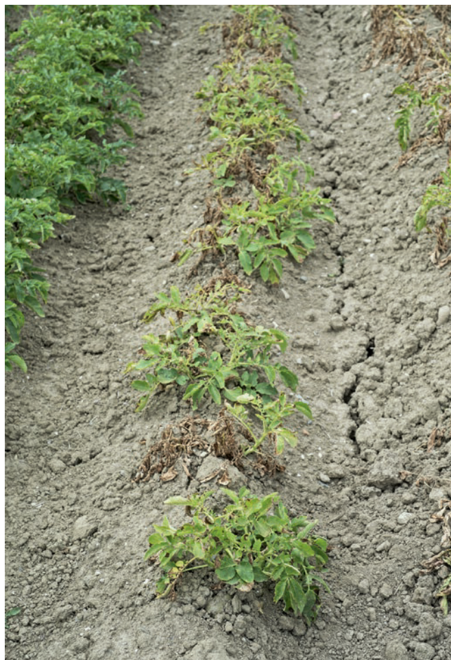
Abb. 4 | Die Sorte Charlotte leidet unter der Trockenheit und stirbt rasch ab. Ein Befall durch Alternaria ( Alternaria solani ), Colletotrichum-Welke ( Colletotrichum coccodes ) oder Verticillium-Welke ( Verticillium spp.) am Ende der Vegetationsperiode kann das Absterben bei trockenen und heissen Wetterbedingungen beschleunigen.