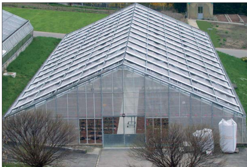
Abb. 1: Nuklearstock für Obstgehölze an der FAW in Wädenswil. Hier befinden sich zur Zeit zirka 450 virusfreie Obstsorten.

Bis 2003 wurde aus dem P1- und P2-Edelreiserschnittgarten der Agroscope FAW Wädenswil in Grabs zertifiziertes Pflanzenmaterial an die Deutschschweizer Baumschulen abgegeben. Seit 2004 befindet sich der Nuklearstock für Obstgehölze an der FAW in Wädenswil (Abb. 1) – Details unter www.nuklearstock.faw.ch . Die P1- und P2-Edelreiserschnittgärten sind bei verschiedenen Obstbaumschulen in der Schweiz.