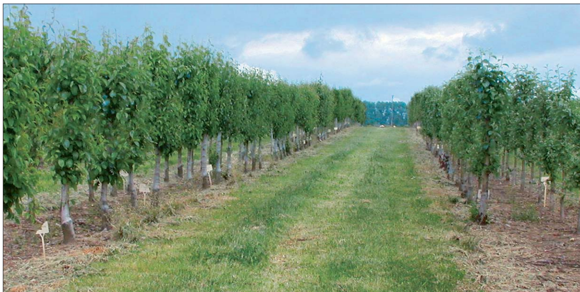
Abb. 4: Zertifizierter Edelreisernschnittgarten (P2) – Birnen im Juni.