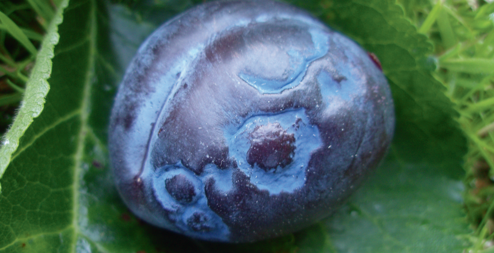
Eine mit Sharka befallene Fellenberg-Zwetschge. Symptômes de la sharka sur des Fellenberg mürs.