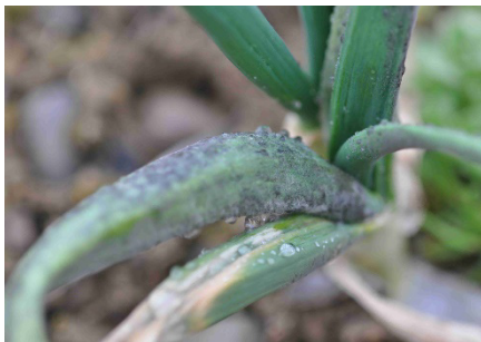
Photo 8: Duvet gris de sporanges du mildiou ( Peronospora destructor ) sur une plante d'oignon hiverné.