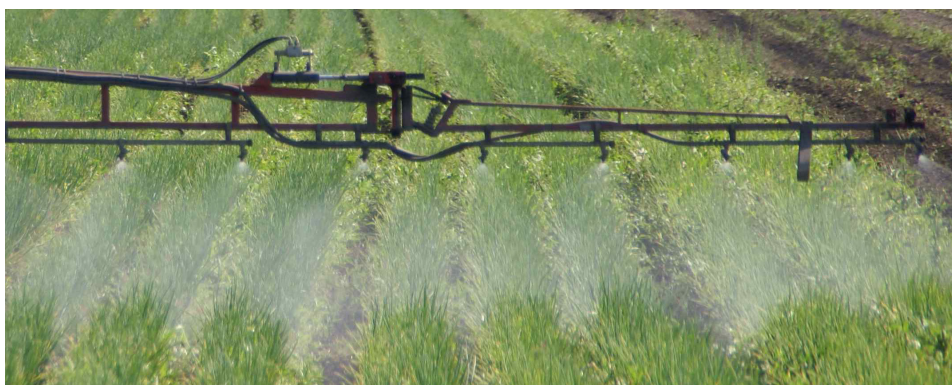
Photo 1: Utilisation de la barre de traitement.

Un cours sur l'utilisation des produits phytosanitaires aura lieu mercredi 15 mars 2023 de 13 h 15 à 16 h 30 à l' Inforama Seeland à Ins . Outre la question des voies de pénétration de produits phytosanitaires dans les eaux, le programme comprend les techniques d'application ainsi que la formation de résistances. Vous trouverez le flyer d'invitation en annexe au courriel de l'Info cultures maraîchères de ce jour.