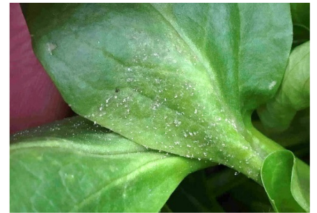
Photo 7: Lorsque la pression d'infection est forte, le mildiou ( Peronospora valerianellae ) se trouve aussi à la face supérieure des feuilles de la mâche.