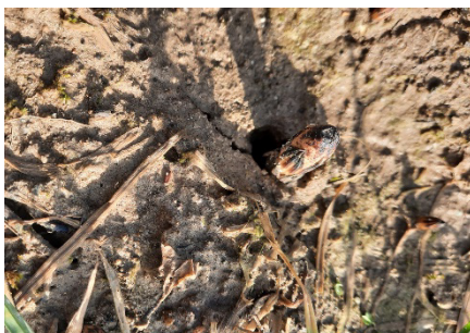
Photo 9: Les tiges des prêles sont déjà visibles dans les zones le plus protégées et chaudes.

Pour lutter contre le mildiou sur oignons, est autorisé avec un délai d'attente de 3 semaines cymoxanil (Cymoxanil WG). On peut aussi utiliser azoxystrobine (divers produits, délai d'attente: 2 semaines), azoxystrobine + difénoconazole (Alibi Flora, Piori Top; délai d'attente: 2 semaines) ou fluazinam (divers produits; délai d'attente: 1 semaine).