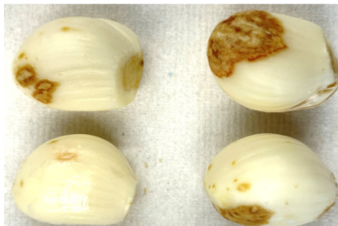
Figure 2: Caïeux d'ail atteints par Fusarium proliferatum.

L'ail est attaqué par de nombreux pathogènes. Au cours de l'année passée, Fusarium proliferatum a causé fréquemment des pertes massives. Ce champignon attaque les caïeux (fig. 2) sans que les dégâts soient visibles sur la tête encore garnie de ses tuniques.