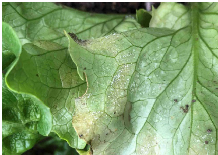
Photo 5: Duvet blanc de sporanges du mildiou de la laitue ( Bremia lactucae ) à la face inférieure des feuilles d'une salade de serre.