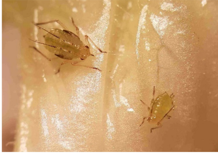
Photo 2: On peut observer actuellement diverses espèces de pucerons (Aphidoidea) sur les salades cultivées en serres. Il est recommandé de contrôler les cultures.