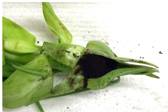
Figure 4: Masse de spores de Microbotryum tragopogonis-pratensis sur inflorescence de salsifis.

tragopogonis-pratensis dans des inflorescences de salsifis véritables (≠ scorsonère !). Comme chez la carie du blé, le champignon forme une masse sombre de spores qui prend la place des akènes (fig. 4).