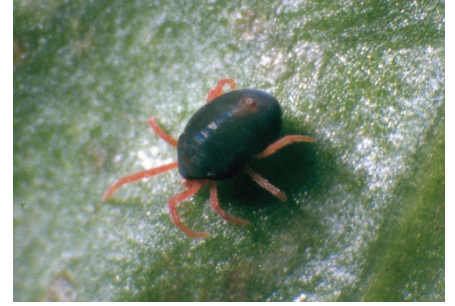
Photo 4: P. major tend à proliférer sous abri lorsque l'environnement est frais et humide. La photo montre une espèce voisine de la même famille des Penthaleidae, reconnaissable au corps foncé, aux pattes rougeâtres et à l'anus circulaire en position dorsale.