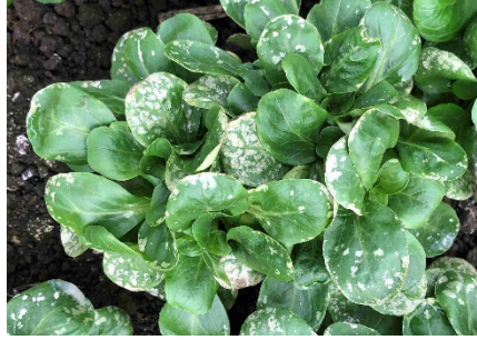
Photo 3: Mouchetures argentées à blanches sur mâche, consécutives aux piqûres de succion de l'acarien d'hiver des céréales ( Penthaleus major , Penthaleidae) (photo : Gaëtan Jaccard, OTM, Morges).