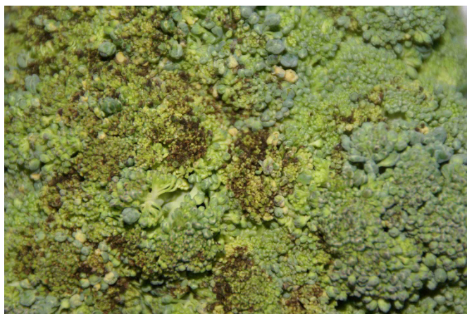
Figure 1: Pourriture de la tête des brocolis causée par Alternaria brassicae.

Dès la fin de l'été, on a constaté dans moult régions que des phénomènes de pourritures touchaient de nombreuses têtes de brocoli. Ces affections étaient dues à divers pathogènes, tels Alternaria spp., mildiou ( Hyaloperonospora parasitica , syn. Peronospora parasitica ), ainsi que diverses espèces de bactéries (p.ex. Pseudomonas spp.).