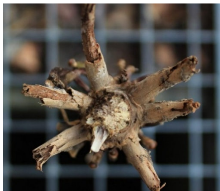
Abbildung 5 | Von der Larve des Maiswurzelbohrers abgefressene Maiswurzeln.