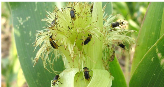
Abbildung 4 | Maiswurzelbohrer beim Abfressen von Maisbart. Bildquelle: www.eppo.org – Fotograf: Peter Baufeld, JKI

Bildquelle: www.eppo.org – Fotograf: Peter Baufeld, JKI