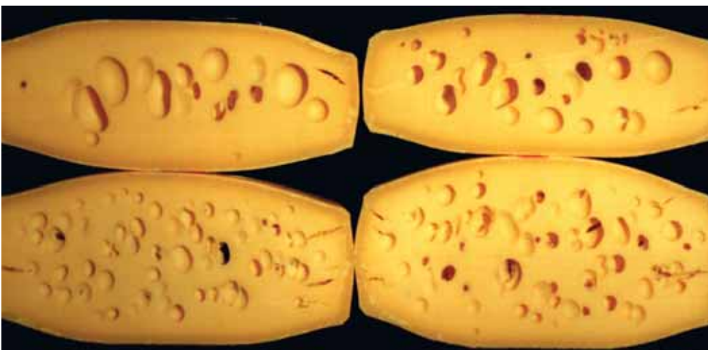
Buttersäurebakterien können schwerwiegende Probleme bei der Käsefabrikation auslösen, deshalb ist die Einhaltung der Hygienevorschriften bei der Verfütterung von Schotte wichtig.

Alle aktuell gültigen Auflagen sind der Verordnung des EVD über die Hygiene bei der Milchproduktion (VHyMP) zu entnehmen.