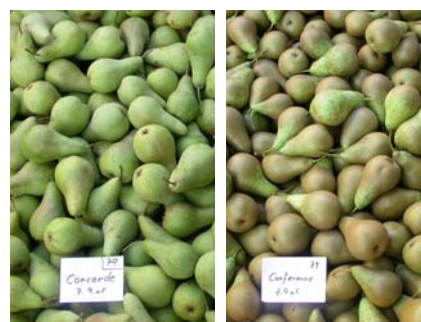
Messwerte durchschnittliches Fruchtgewicht Concorde: 208 g Conférence 187 g

Die Conférence ähnliche Sorte Concorde (links) zeichnet sich aus durch bessere Kaliber und wenig Berostung; das Ertragspotential liegt etwas hinter Conférence (rechts) zurück (Messwerte 2006).