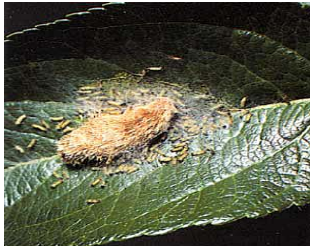
Nach dem Schlüpfen verlassen die jungen Raupen den filzartigen Schutzbelag und befallen die Blätter.