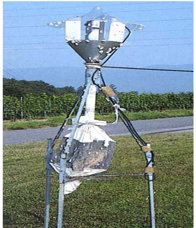
Bei Massenvermehrungen ist die Falterzahl so gross, dass selbst am Morgen noch zahlreiche Individuen um die Lichtfalle beobachtet werden können.