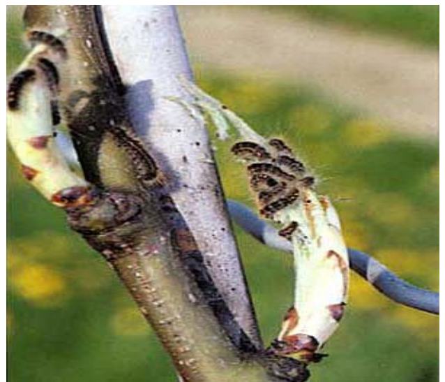
Raupen befallen Birnenknospe.