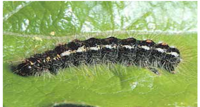
Die ausgewachsene Raupe ist stark mit Brennhaaren bewehrt und misst 30–33 mm.