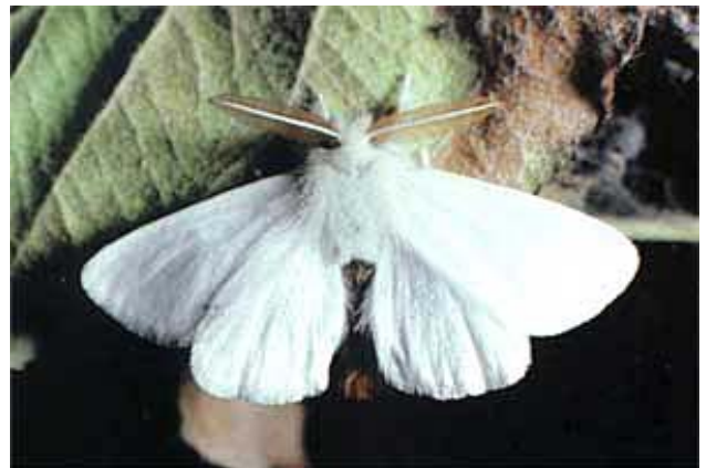
Männlicher Falter des Goldafters Euproctis chrysorrhoea .

Der Goldafter hat nur eine Generation pro Jahr. Die Falter sind nachtaktiv und fliegen im Juli. Die Eier werden in länglichen Gelegen an Blättern und auf dem Holz abgelegt und mit braunen Haaren des Weibchens bedeckt. Nach ungefähr acht Tagen schlüpfen die Junglarven, die sich vorerst durch oberflächlichen Fensterfrass an den Blättern ernähren. Im Verlauf der Frasstätigkeit spinnen sie gemeinsam mehrere Blätter zusammen und bilden ein starkes, zeltartiges Gespinnst, das bei schlechter Witterung Schutz bietet. Bei sonnigem Wetter verlassen die Raupen das Gespinnst und fressen in grösseren Gruppen an den Blättern. Im Herbst treten sie in Diapause und überwintern gemeinsam, gut geschützt im dichten, grauen Seidengespinnt. Sobald die Temperatur im Frühjahr über 10–15 °C steigt, werden die Raupen wieder aktiv. Tagsüber verlassen sie das Gespinnst, um sich von Knospen und Blättern zu ernähren. Im Laufe