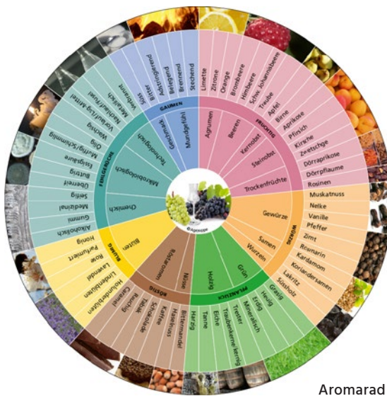
Aromarad für Grappa und Marc. (© Agroscope)

Das Aromarad Grappa und Marc besteht aus drei konzentrischen Kreisen. Diese sind durch den mittleren Kreis farblich gruppiert, in sieben Wahrnehmungskategorien (fruchtig, würzig, pflanzlich, röstig, blumig, Fehlgerüche und Gaumen) gegliedert. Die Kategorien werden im inneren Kreis in Unterkategorien aufgeteilt. Der äussere Kreis enthält 68 Attribute, die die Beschreibung von Grappa und Marc vereinfachen. Sämtliche Aromaräder können kostenlos über den nebenstehenden