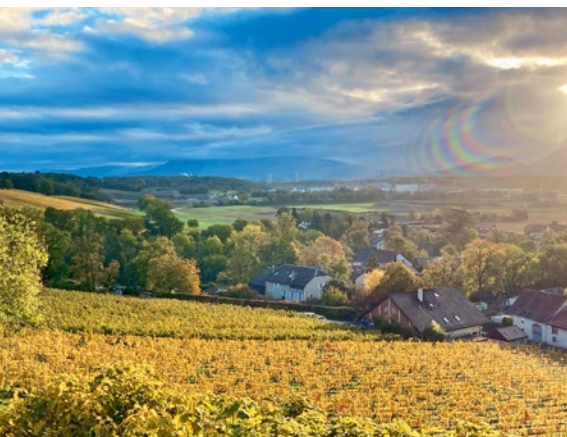
Nur unweit der Grossstadt zu finden: Genfs Weinberge.